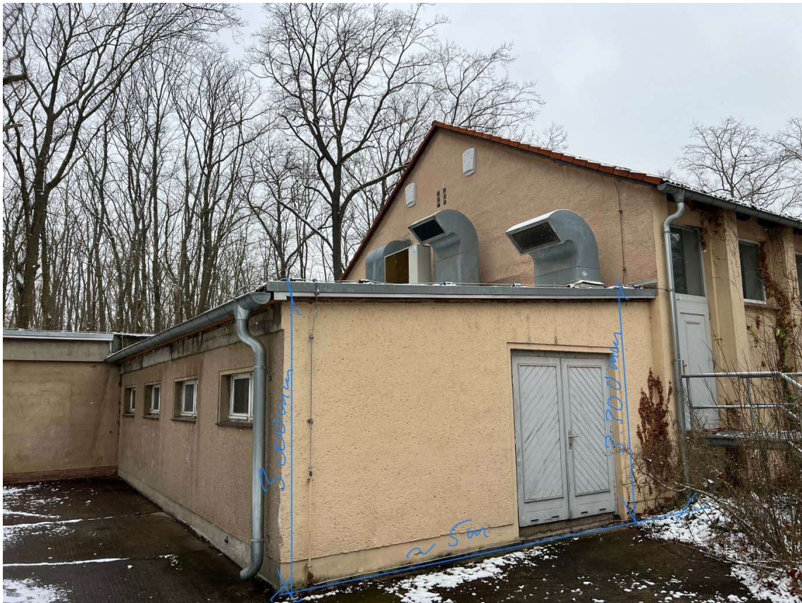
01 Außenansicht Geb. 17