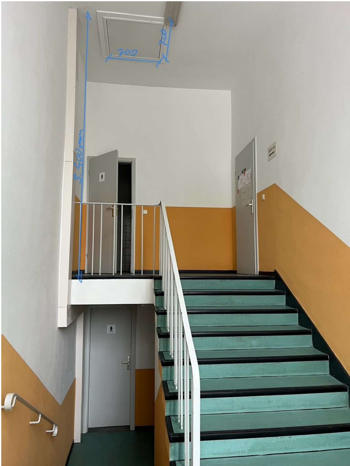
08 Luke Einbringöffnung in Spitzboden