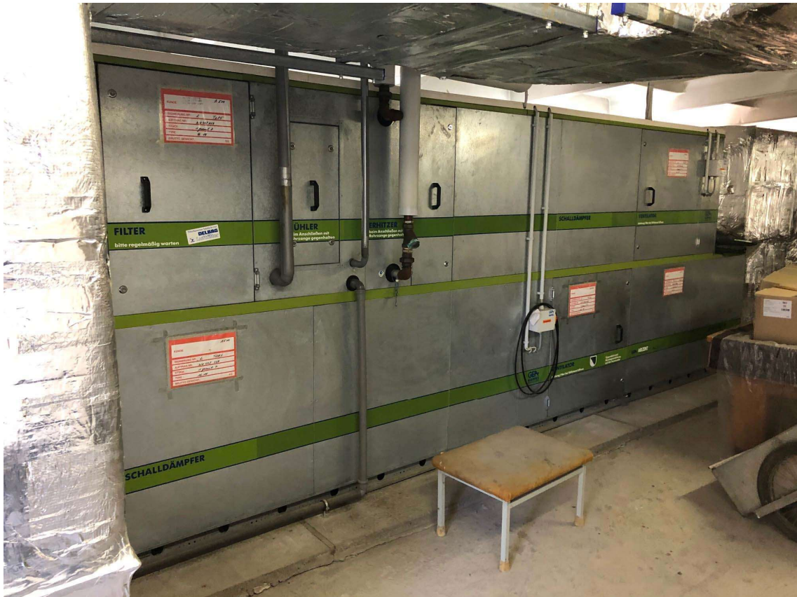
03 RLT-Gerät Bestand