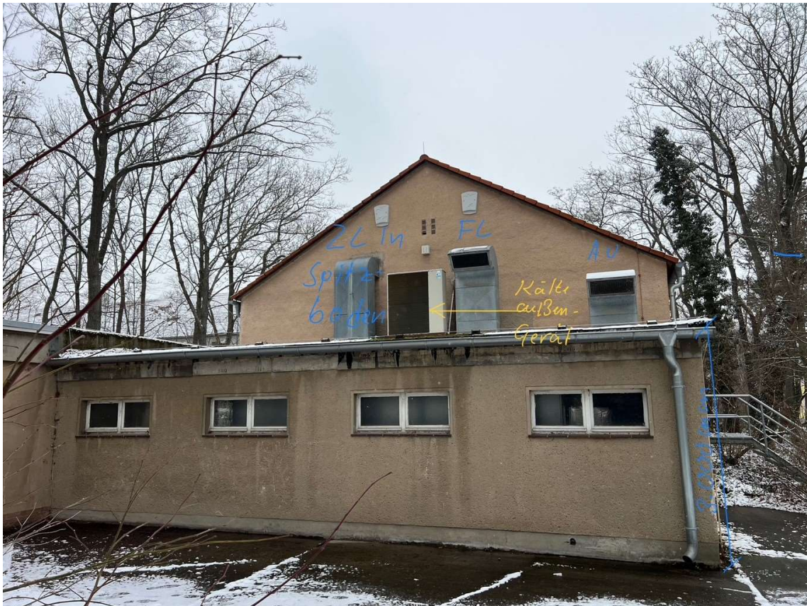
02 Außenansicht Geb. 17