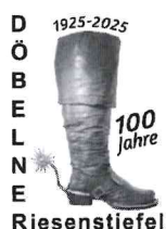
Konstanze Becker Vergabestelle – Stadt Döbeln