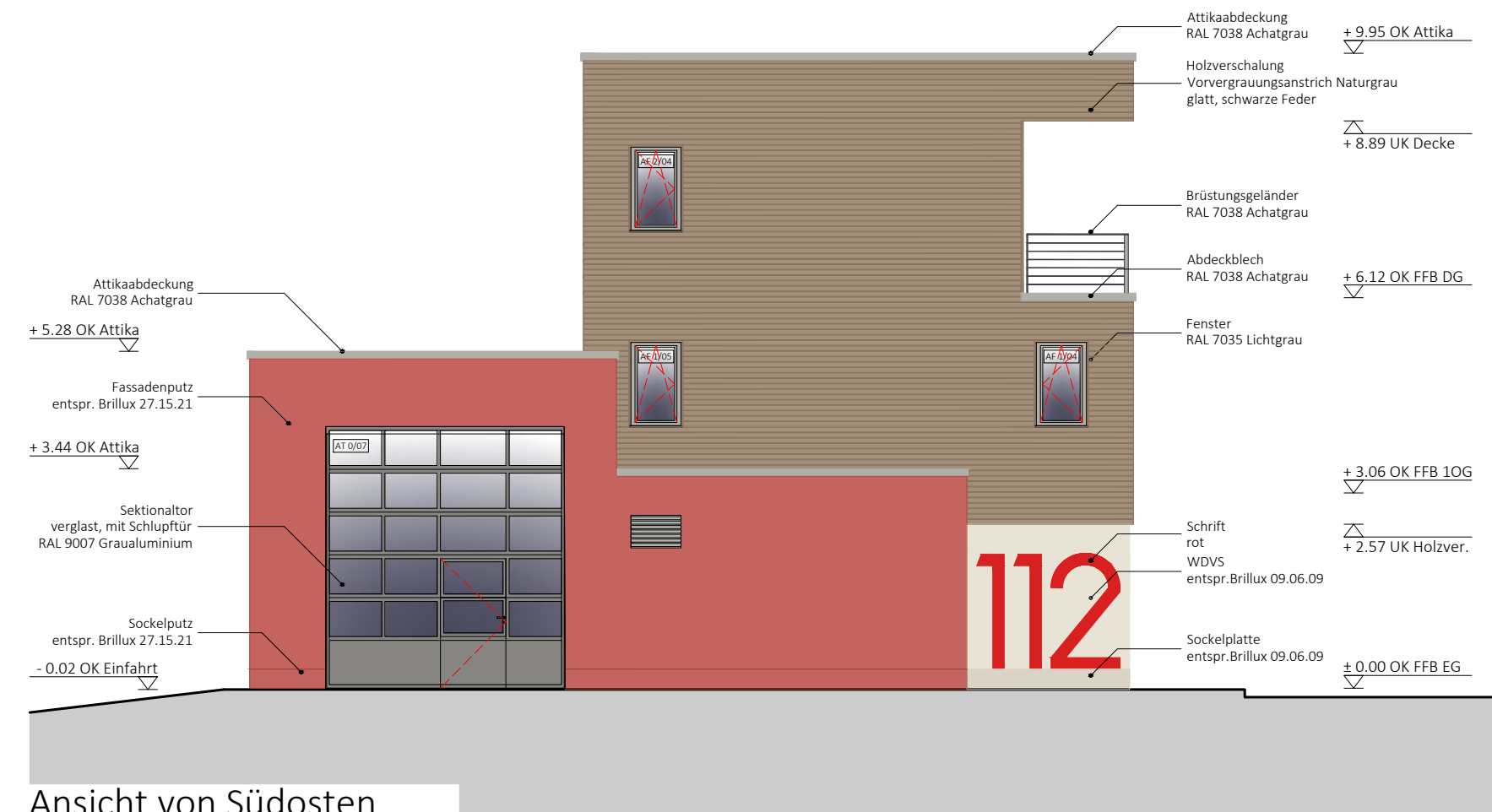
Ansicht von Südosten