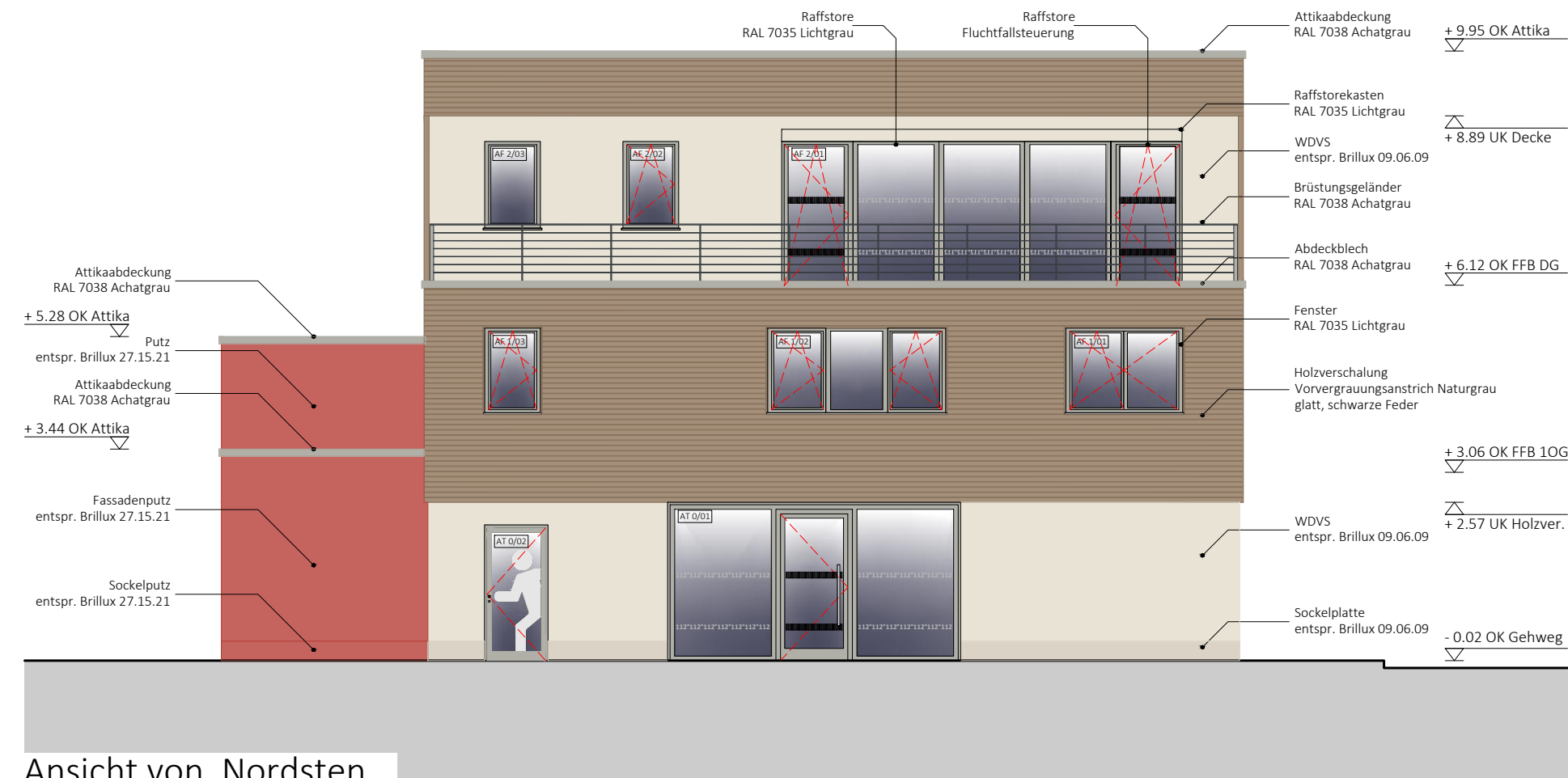
Ansicht von Nordsten