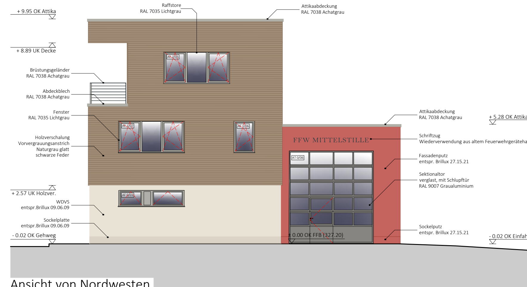
Ansicht von Nordwesten