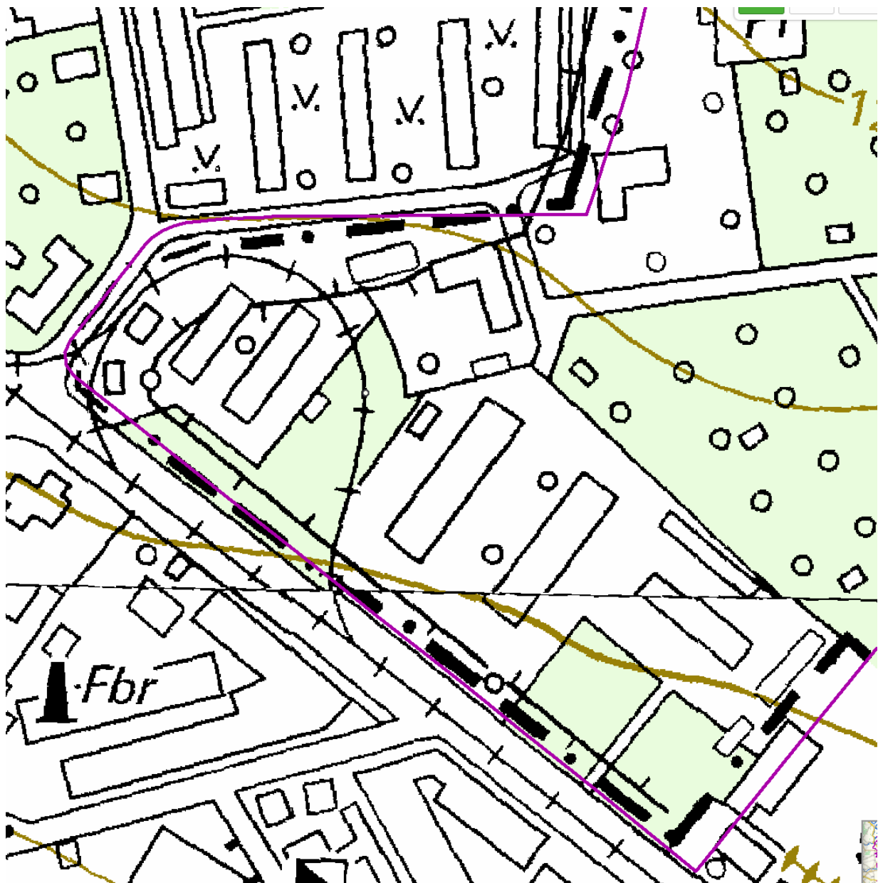
Topografische Karte vor 2008*