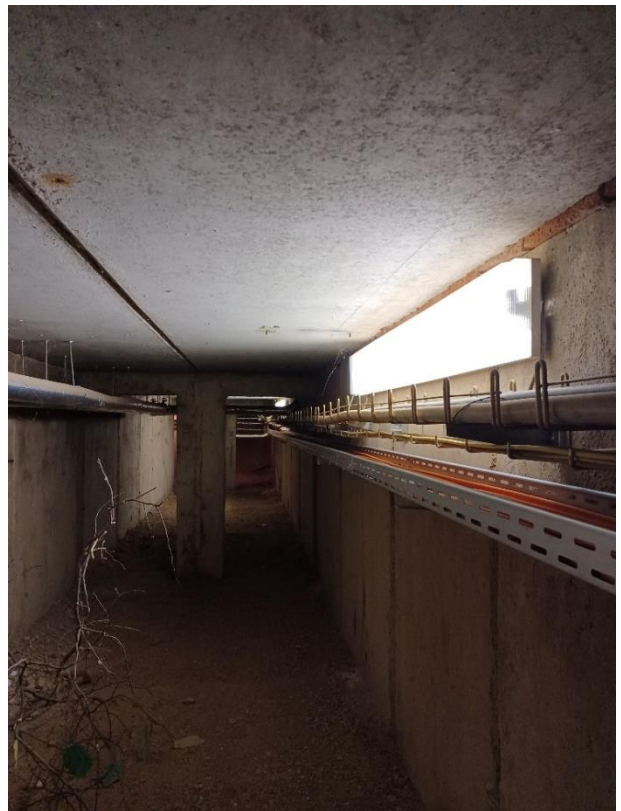
30 Hauptgebäude Keller, Kriechgang unter den Verbindern zum Nebengebäude