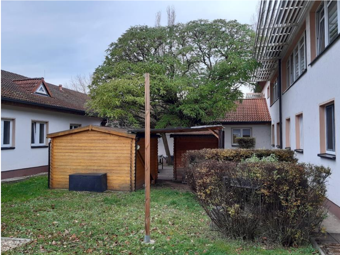
15 Innenhof, Ansicht aus Nord/Ost