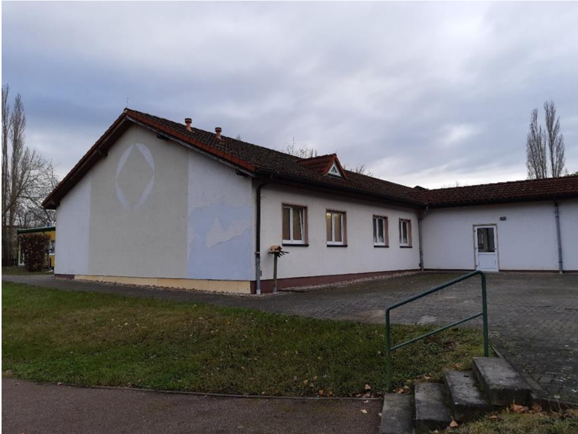
9 Nebengebäude und Verbinder, Außenseite Schulhof, Ansicht aus Nord/Ost