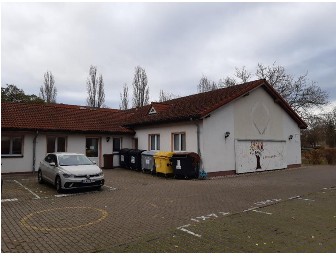
4 Verbinder mit Wirtschaftseingang und Nebengebäude, Ansicht aus Nord/West