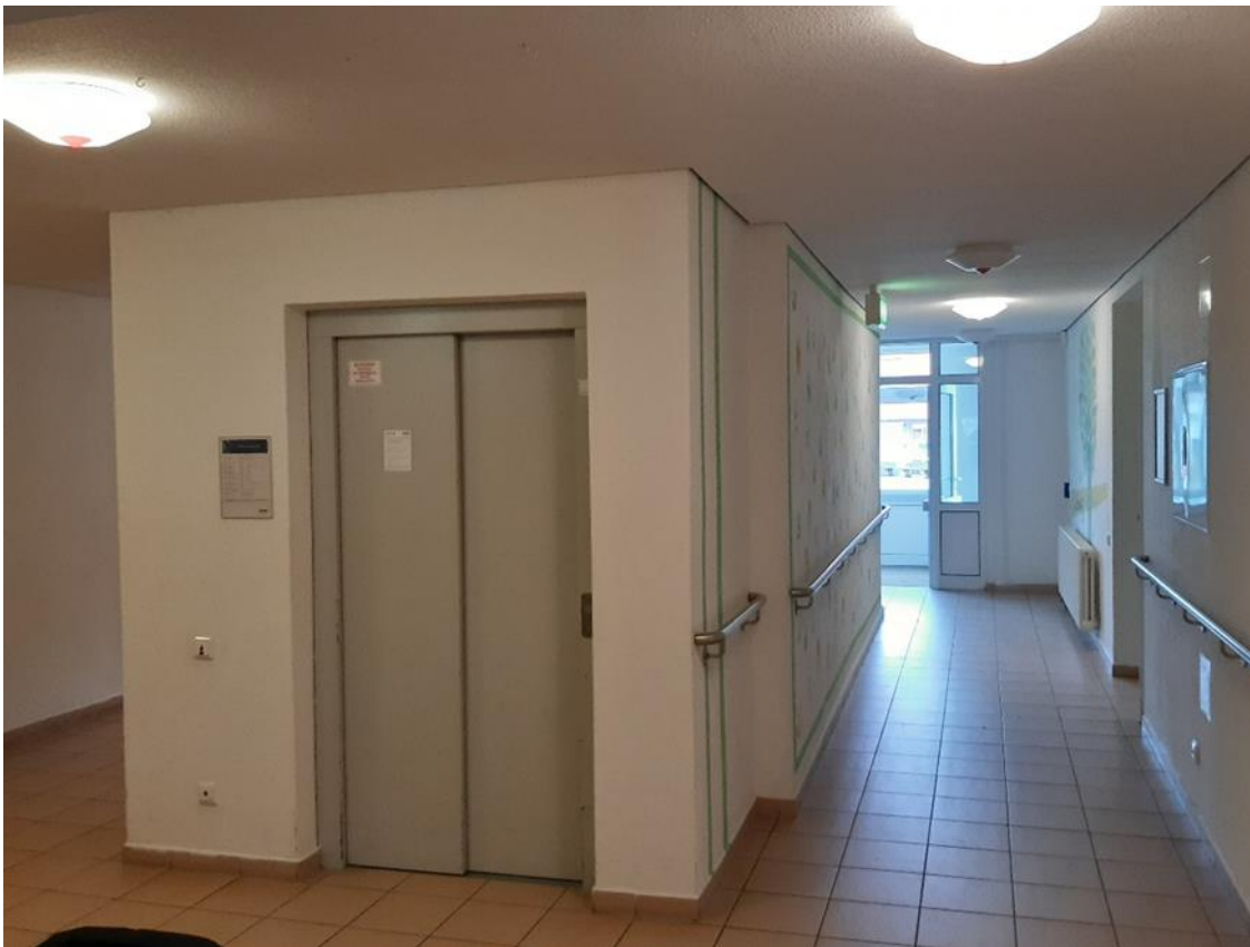
20 Hauptgebäude, Aufzug am Haupteingang, Sicht zum Haupteingang