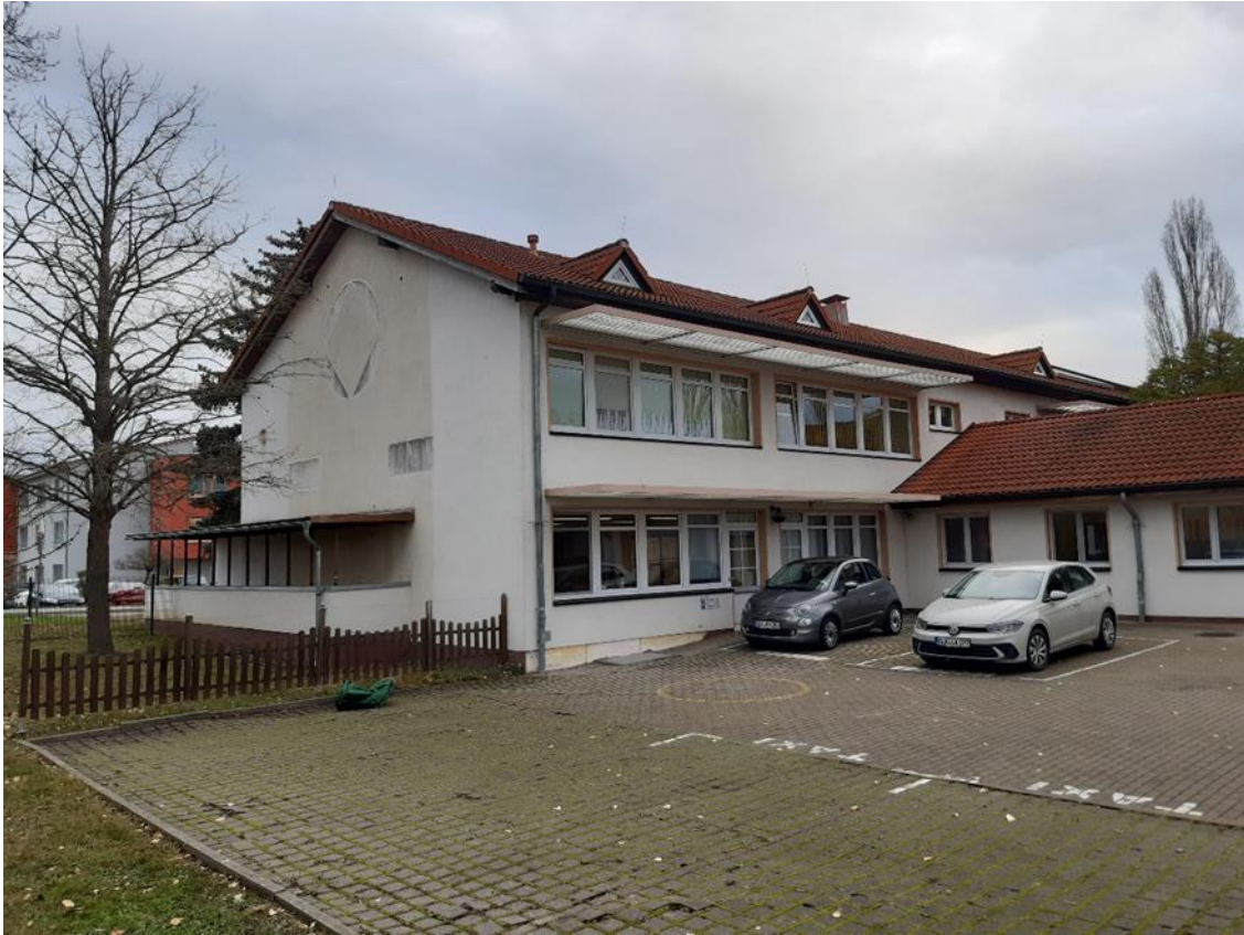
3 Hauptgebäude, Rückseite mit Verbinder, Ansicht aus Süd/West