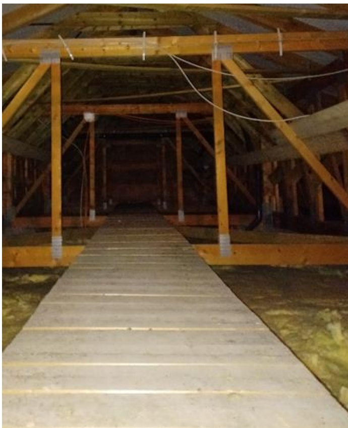
24 Hauptgebäude, Dachboden, Dachkonstruktion (Errichtung ca. 1995)