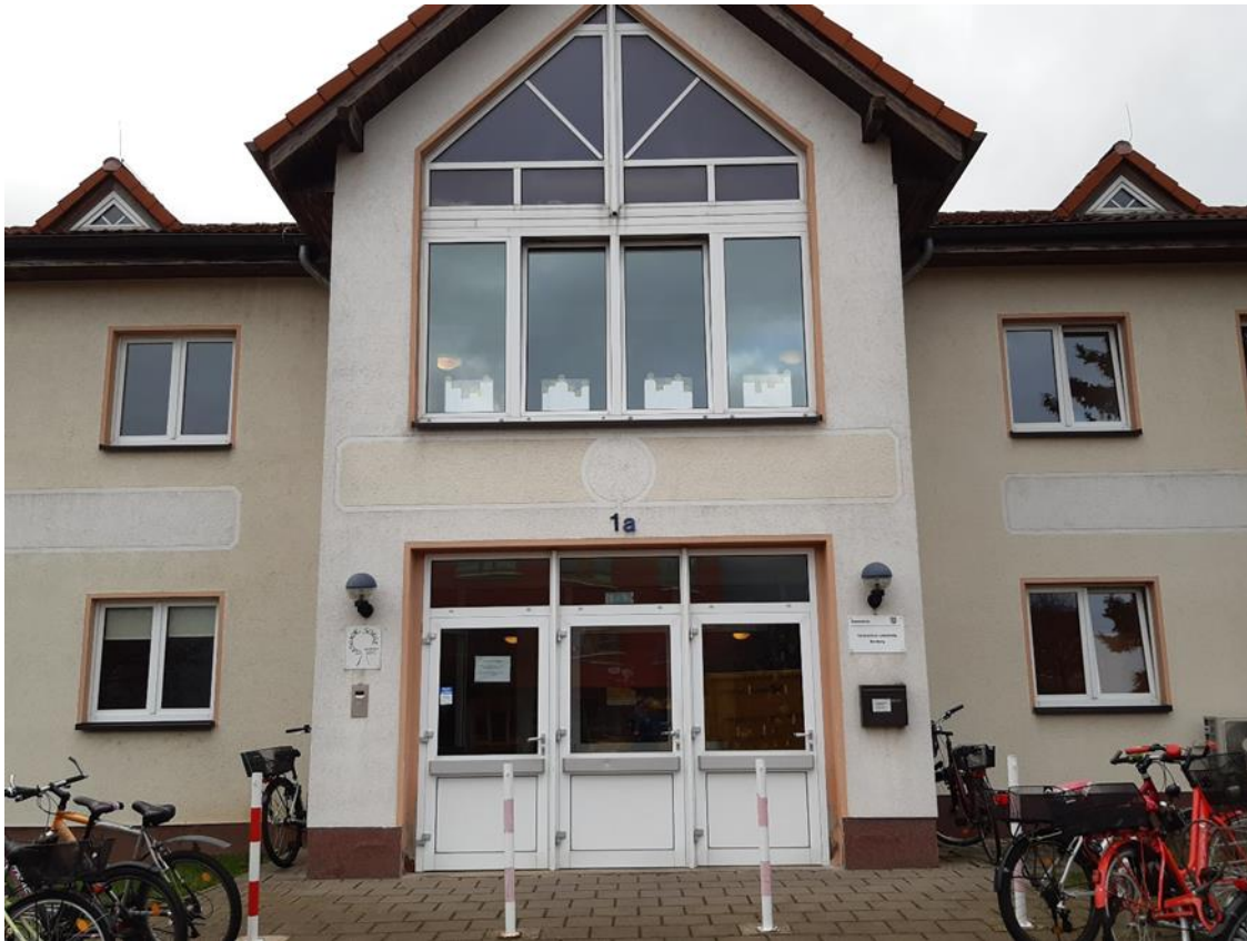
1 Hauptgebäude, Straßenseite, Haupteingang, Ansicht aus Nord/West