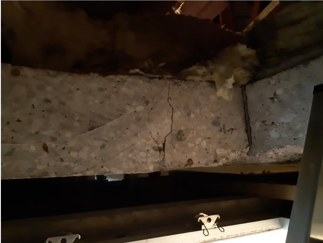
27 Hauptgebäude Dachboden, Betondeckenelement (Ausschnitt Dachzugang)