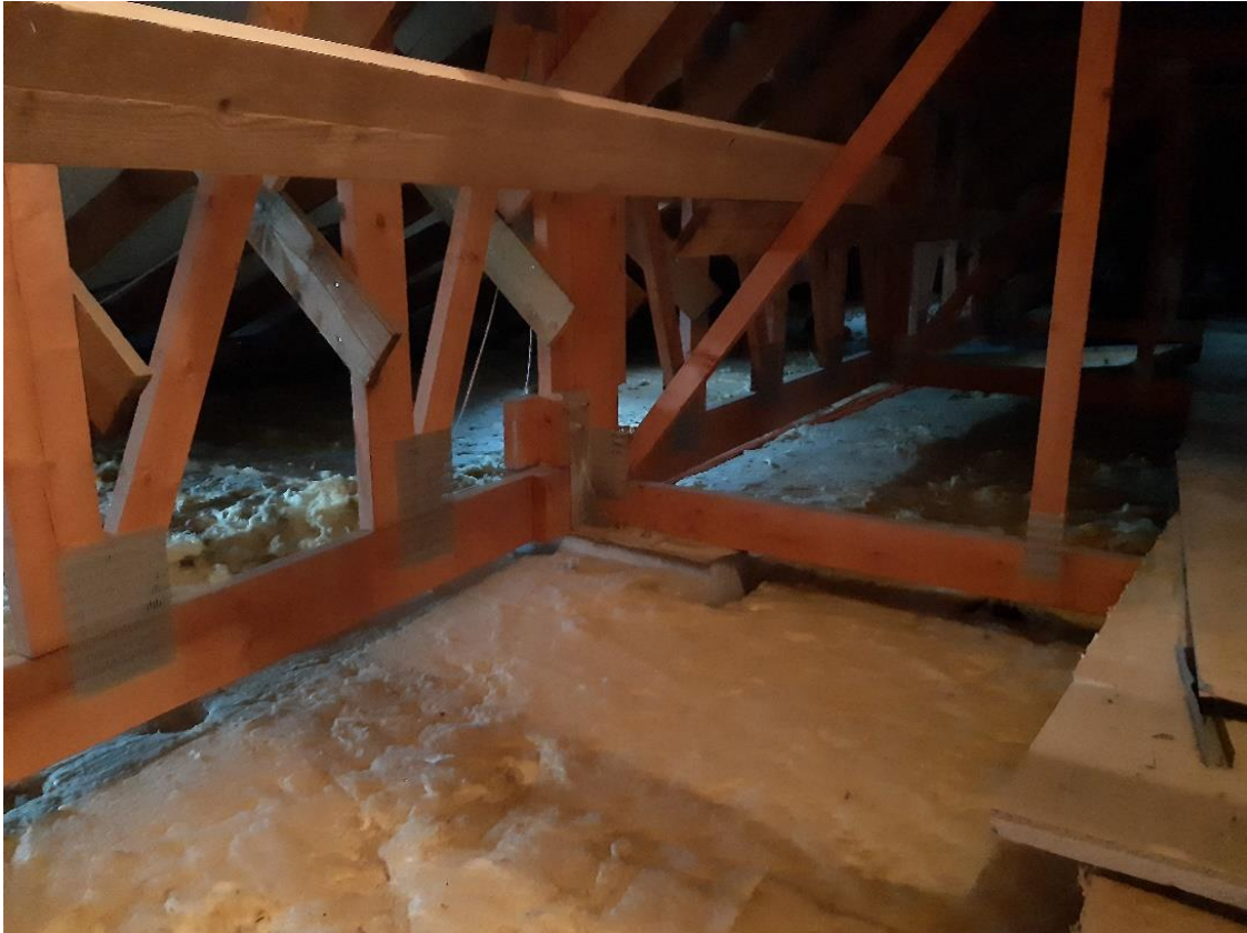
23 Hauptgebäude, Dachboden, Auflager Dachkonstruktion