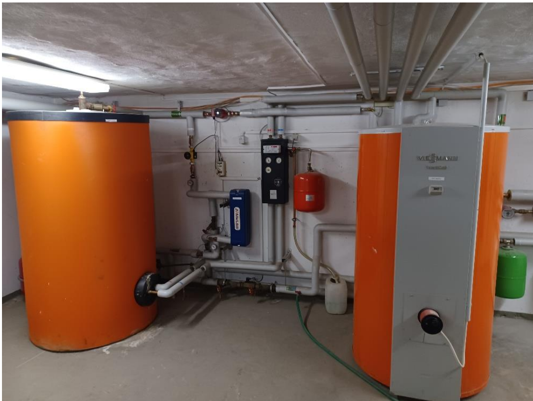
32 Hauptgebäude Keller, Warmwasserspeicher