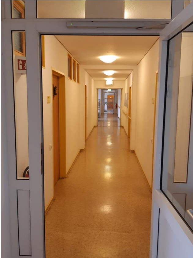
17 Hauptgebäude, Flur im EG