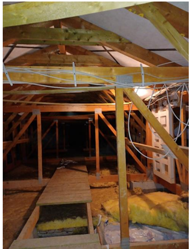
28 Nebengebäude, Dachboden, Dachkonstruktion (Errichtung ca. 1995)