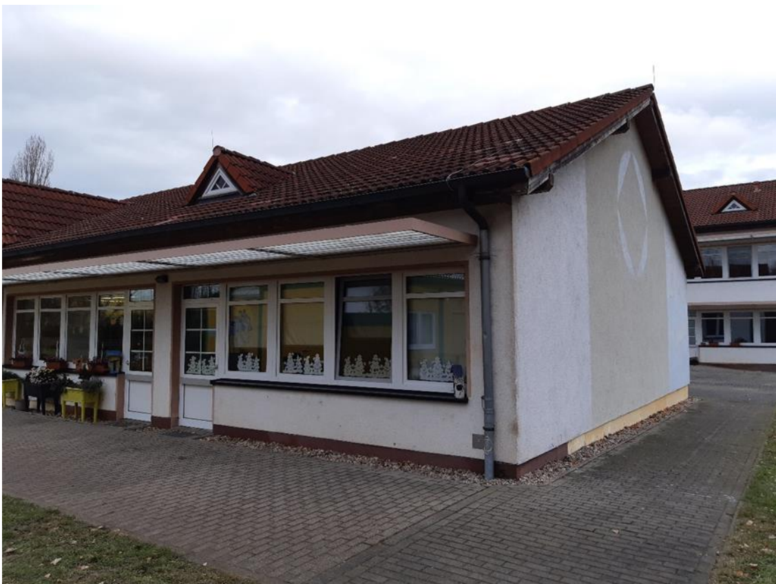
8 Nebengebäude, Schulhofseite, Ansicht aus Süd/Ost