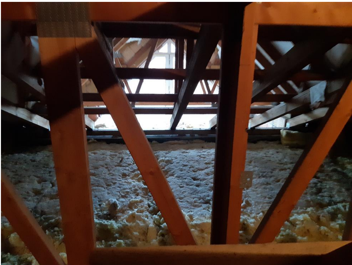
22 Hauptgebäude, Dachboden mit Fenstergiebel Haupteingang