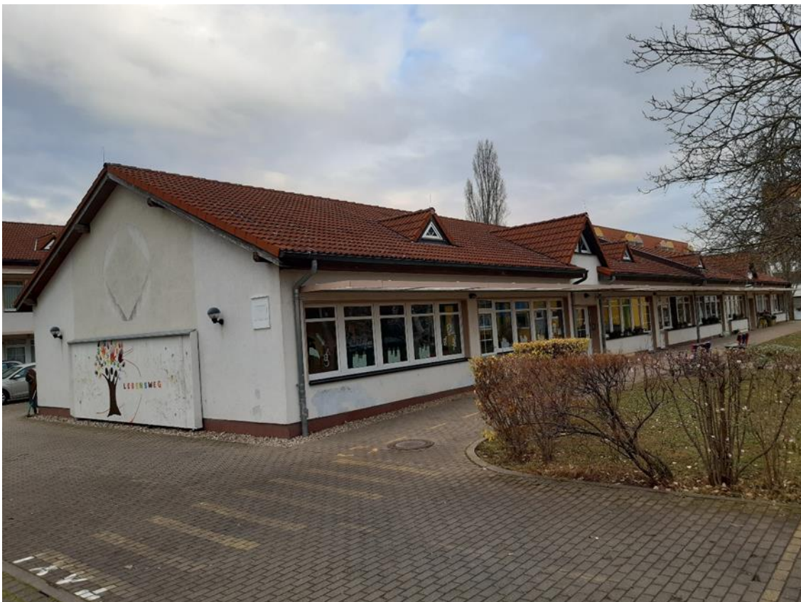
6 Nebengebäude und Parkplatzauffahrt, Schulhofseite, Ansicht aus Süd/West