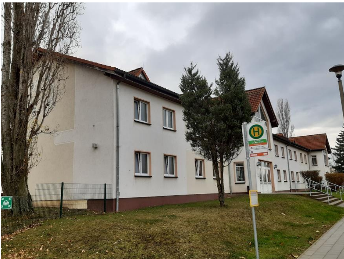
12 Hauptgebäude, Straßenseite mit Nebeneingang, Ansicht aus Nord/Ost