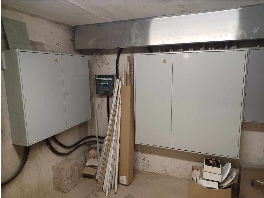
29 Hauptgebäude Keller, Stromverteilung