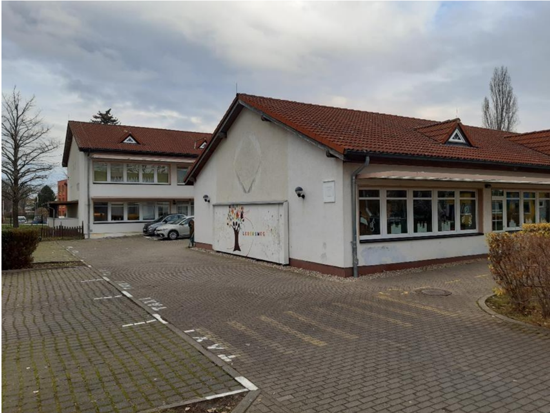
5 Nebengebäude und Parkplatzsituation Schülerbeförderung, Ansicht aus Süd