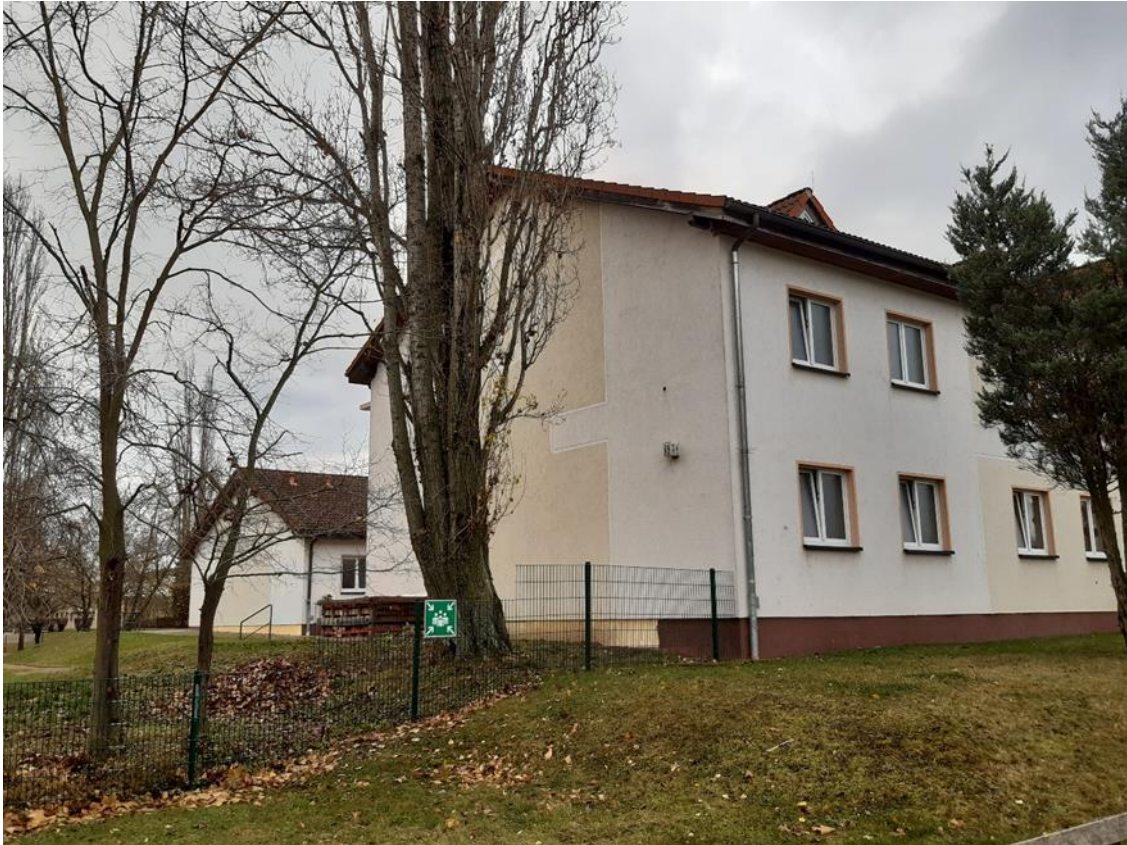
11 Hauptgebäude, Straßenseite, Ansicht aus Nord