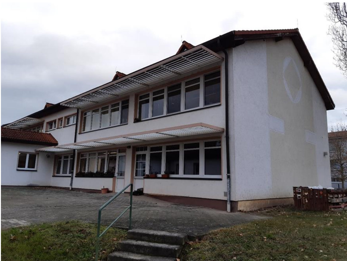
10 Hauptgebäude, Außenseite Schulhof, Ansicht aus Süd/Ost