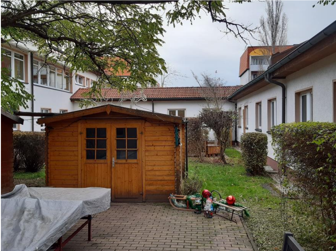
13 Innenhof, Ansicht aus Süd/West