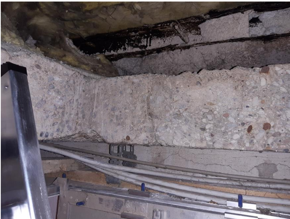
26 Hauptgebäude, Dachboden, ursprüngliches Flachdach mit Bitumenabdichtung