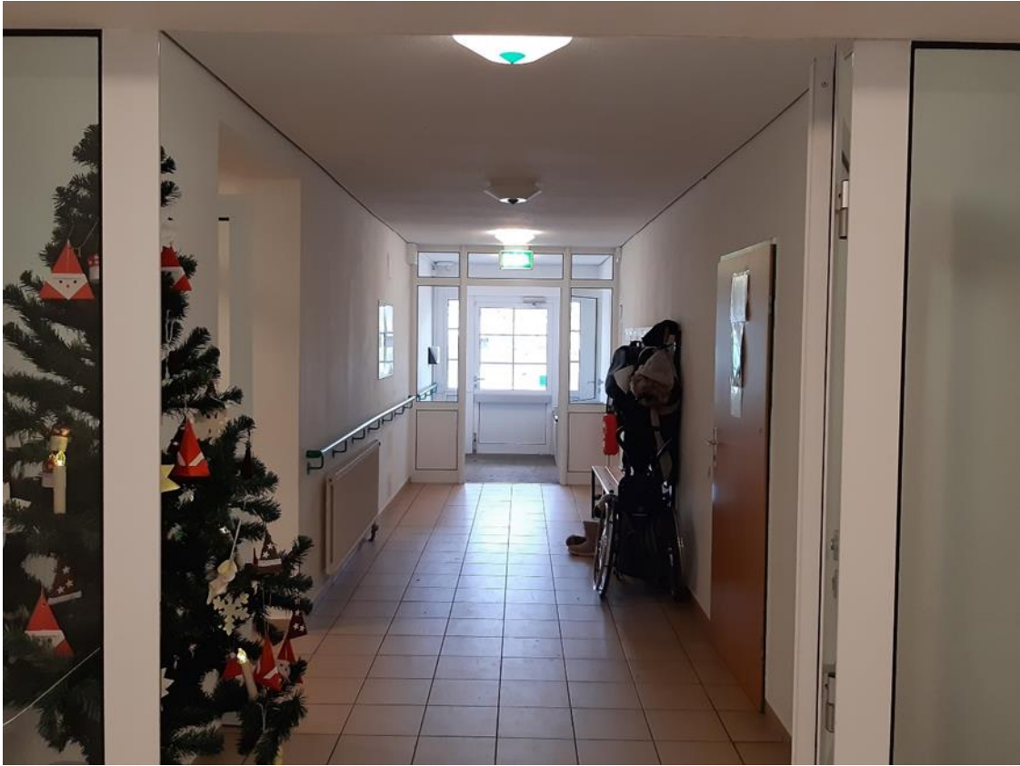
19 Hauptgebäude, Verbinder zum Nebengebäude