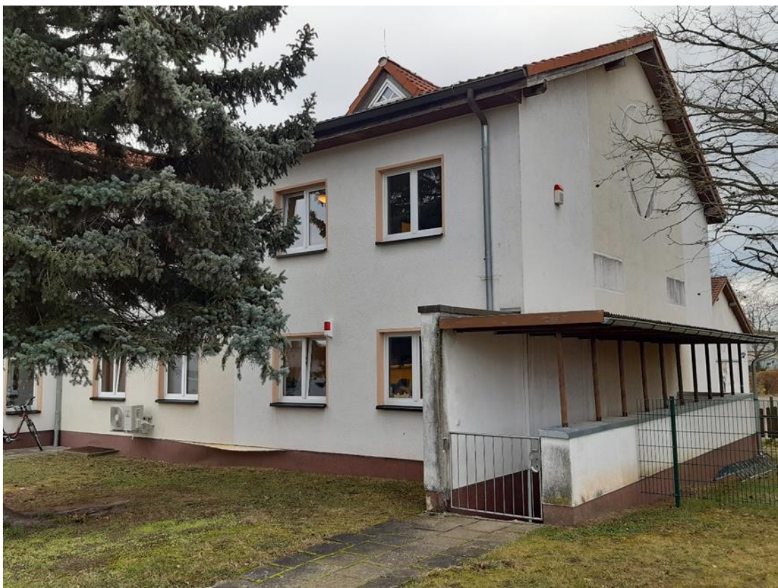
2 Hauptgebäude, Straßenseite, Keller-Außeneingang, Ansicht aus Nord/West