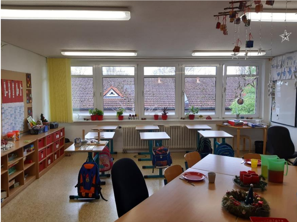
21 Hauptgebäude, Klassenraum