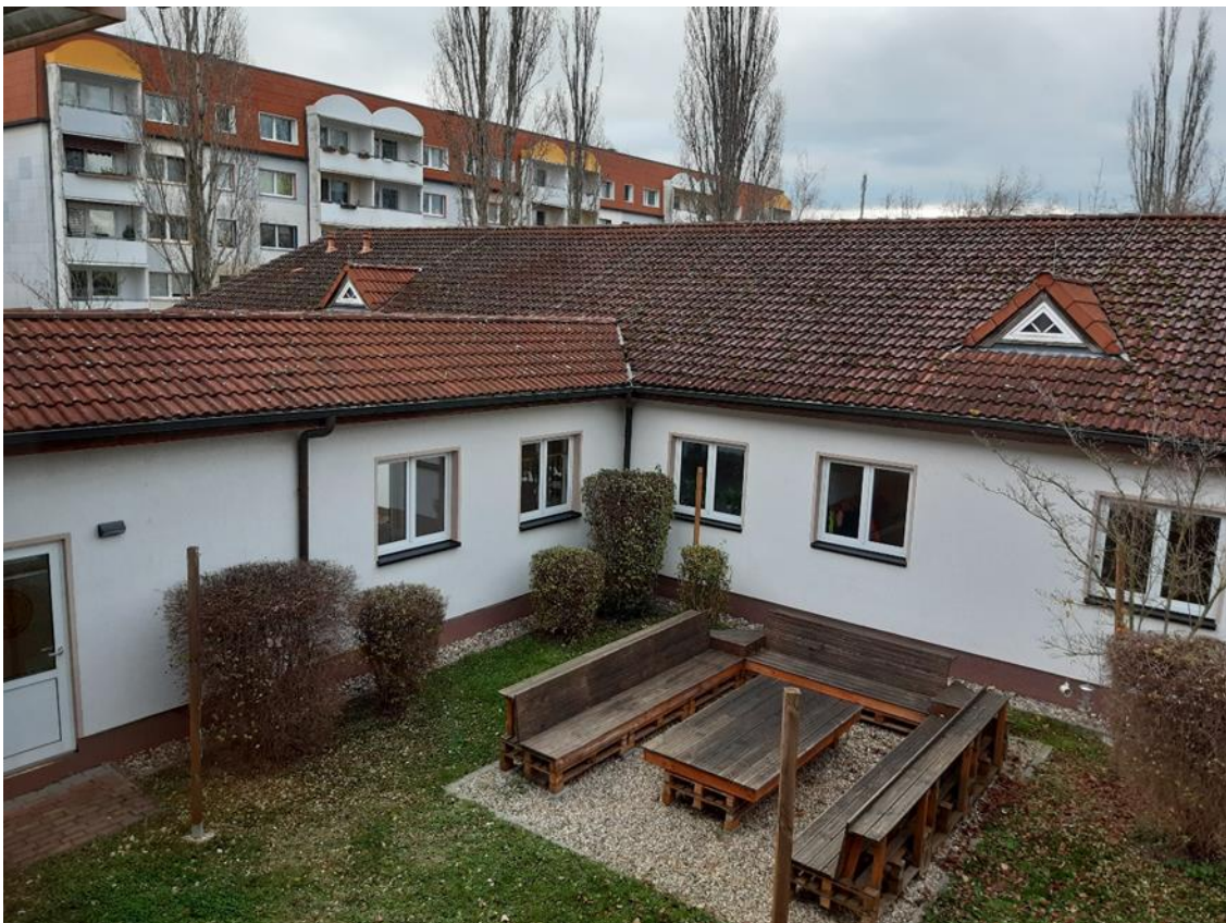
16 Innenhof, Ansicht aus West aus dem OG Hauptgebäude