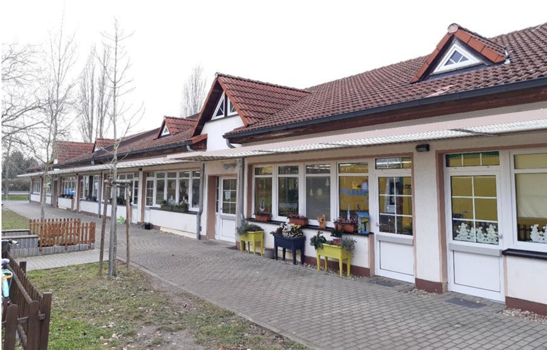
7 Nebengebäude, Schulhofseite, Ansicht aus Ost