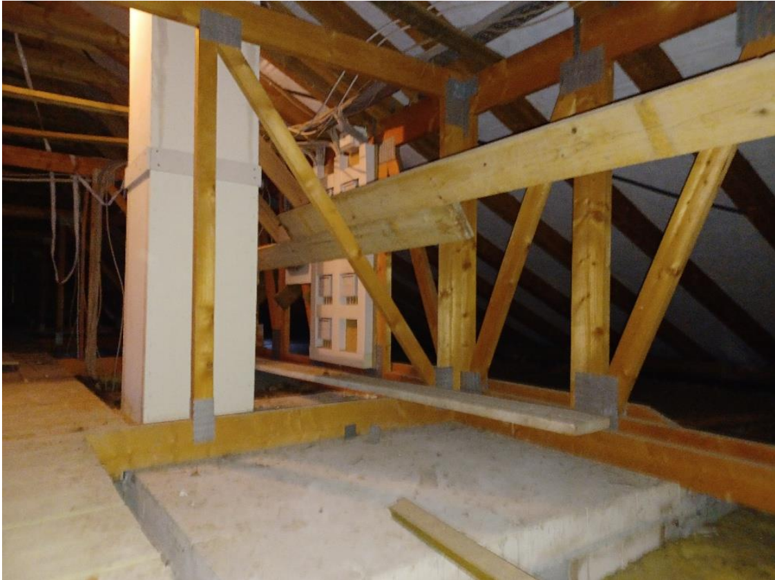
25 Hauptgebäude, Dachboden, Dachkonstruktion (Errichtung ca. 1995)