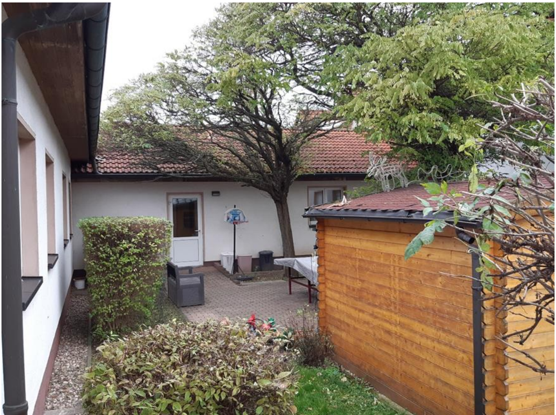
14 Innenhof, Ansicht aus Nord/Ost