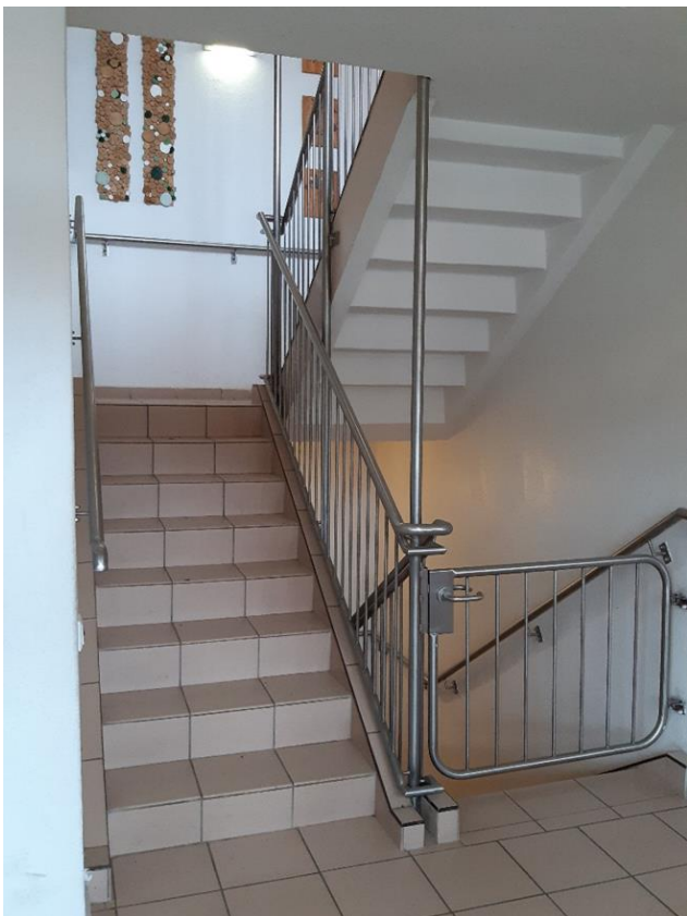
18 Hauptgebäude, Treppenanlage vom Keller bis ins Obergeschoss