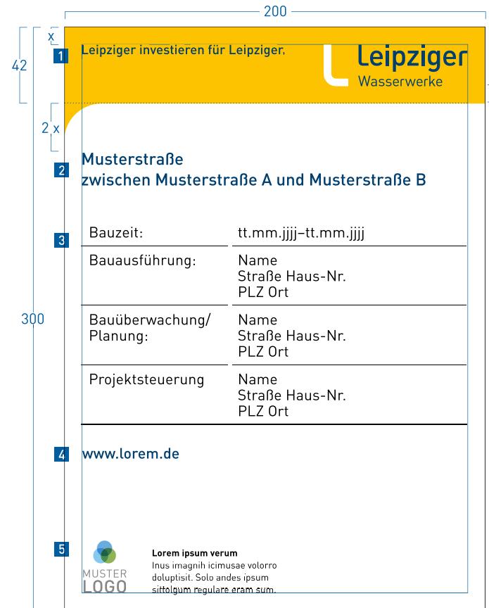
Variante 1: Herstellung als Gesamtschild