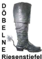
Konstanze Becker Vergabestelle – Stadt Döbeln