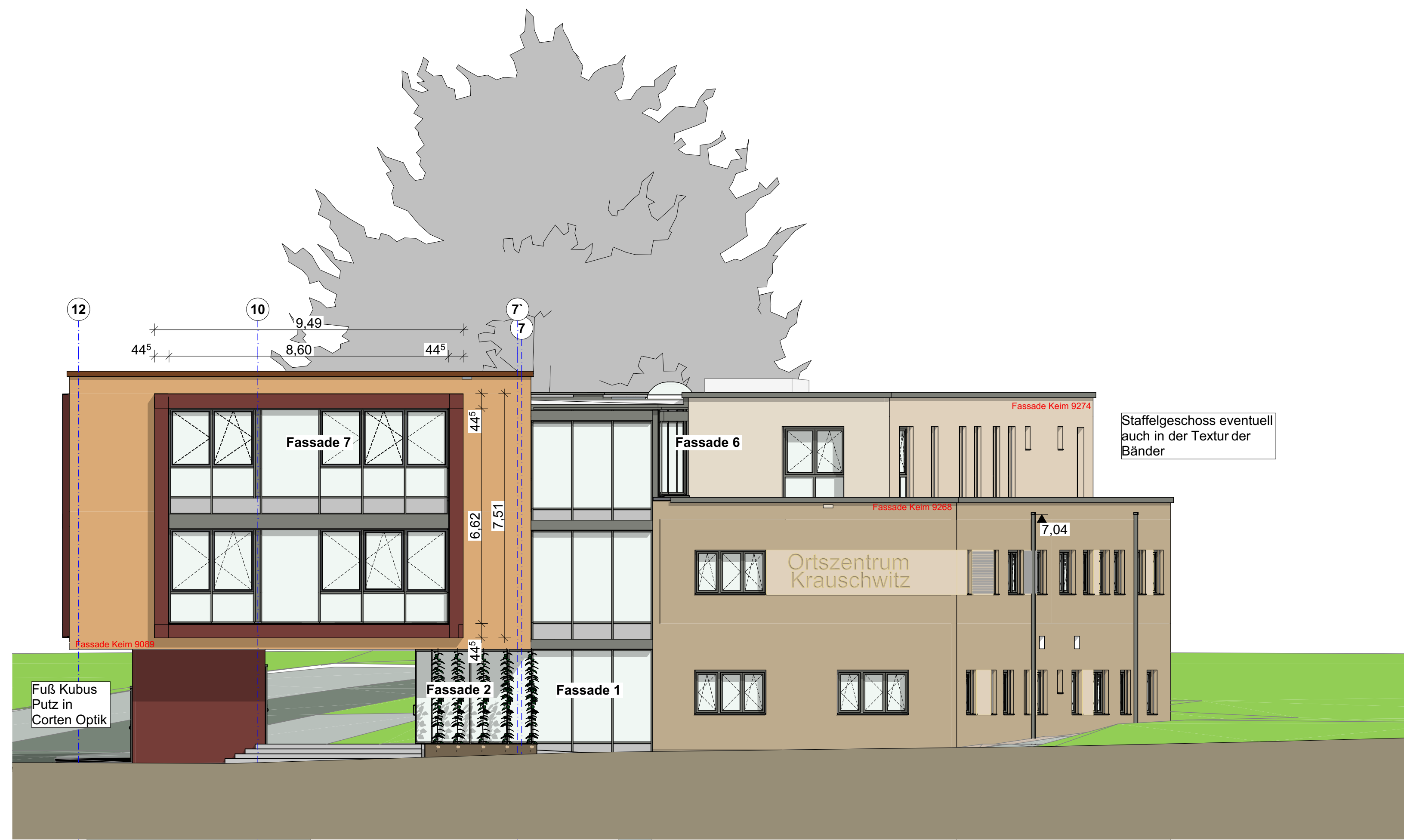
A-01 Ansicht West 1:100