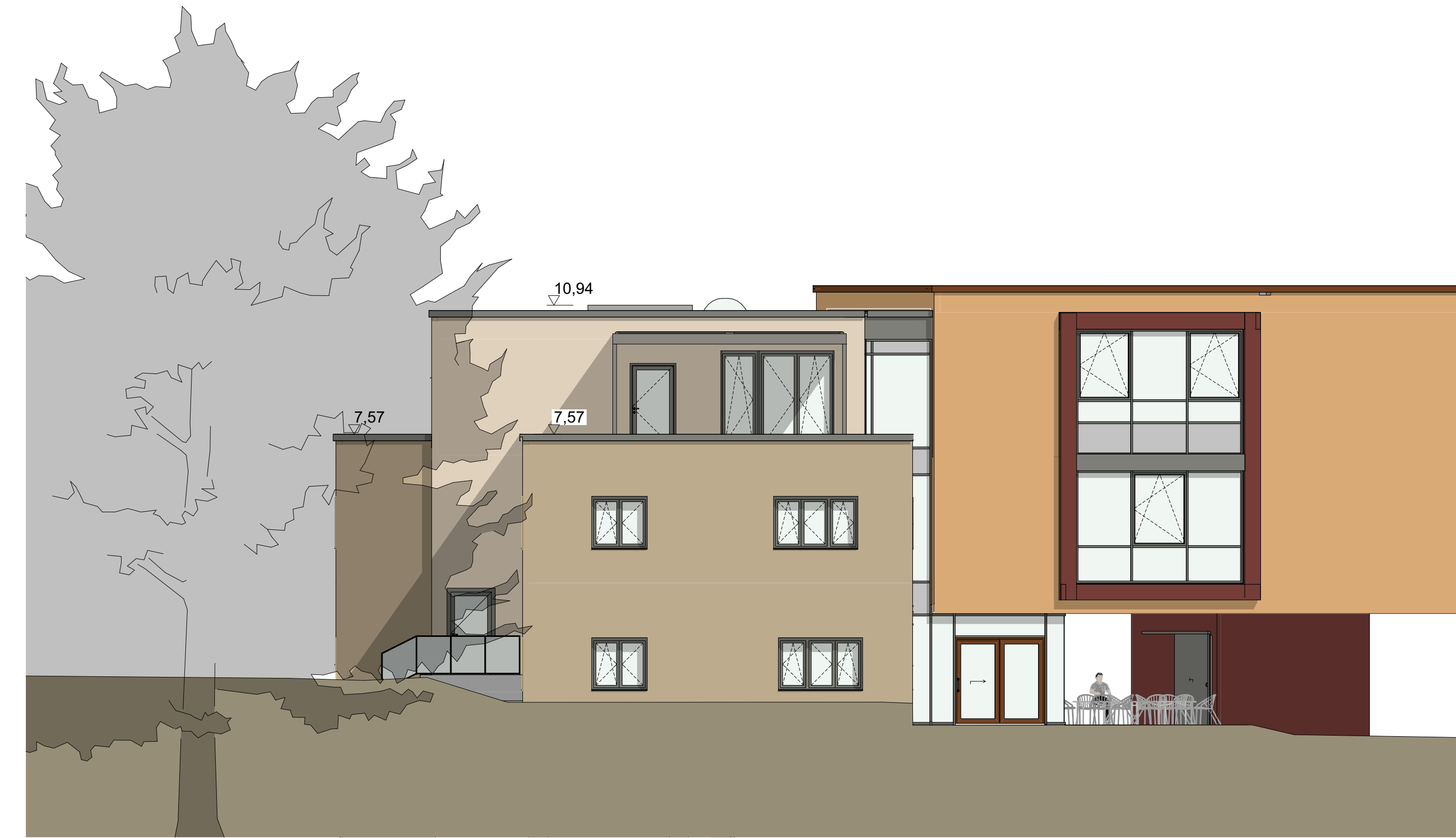
A-03 Ansicht Ost 1:100