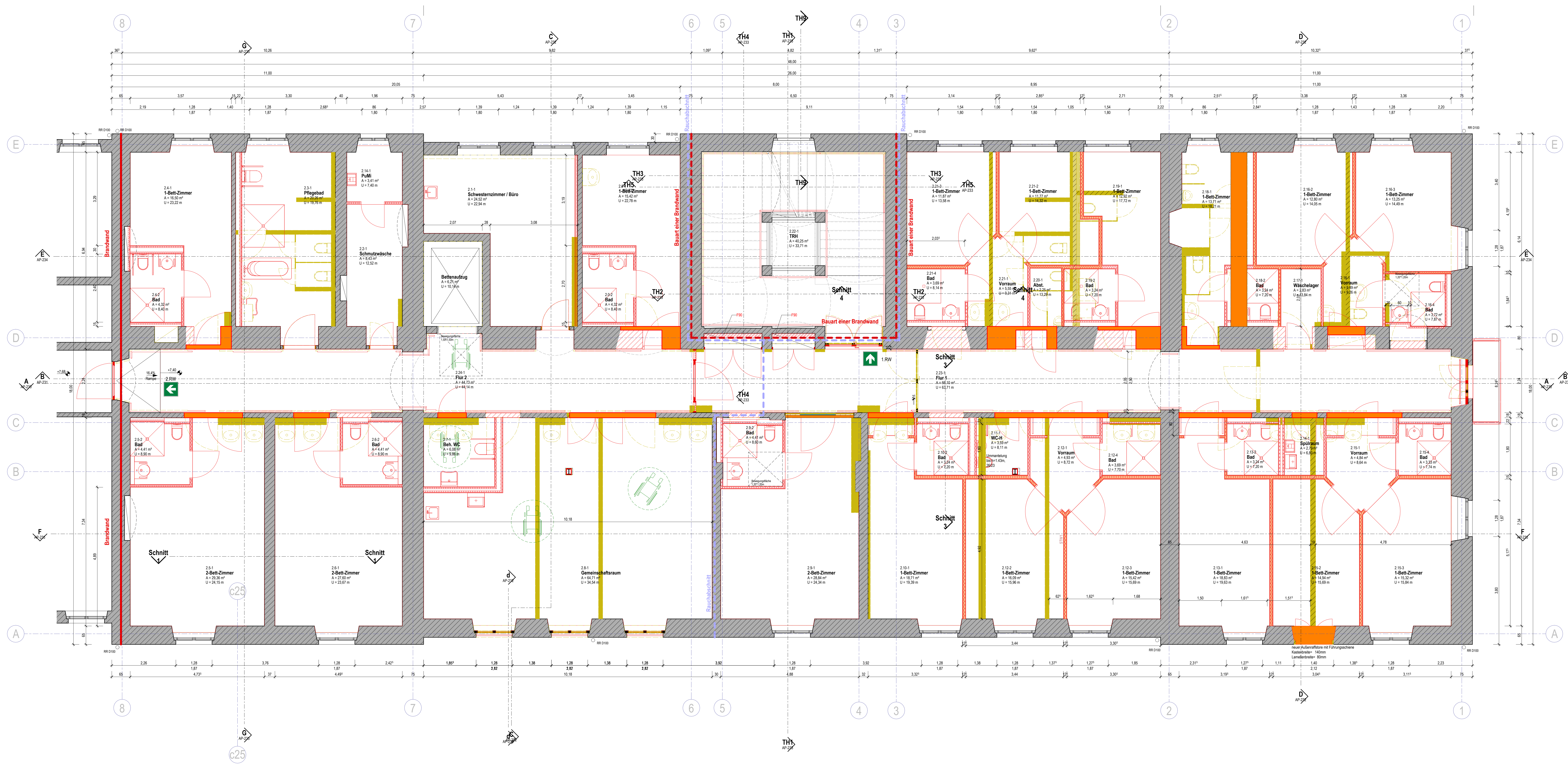
Grundriss 2.Obergeschoss Bestand, Abbruch und Neubau 1:1:50