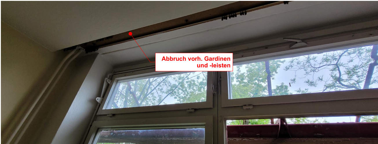
Oberlicht Kippen durch Gestänge