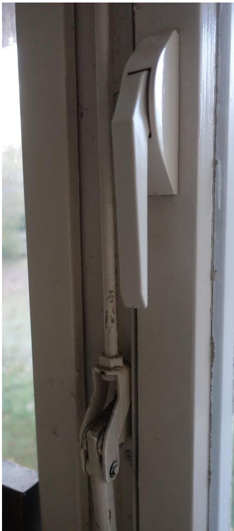
Fenstergriff und Gestänge