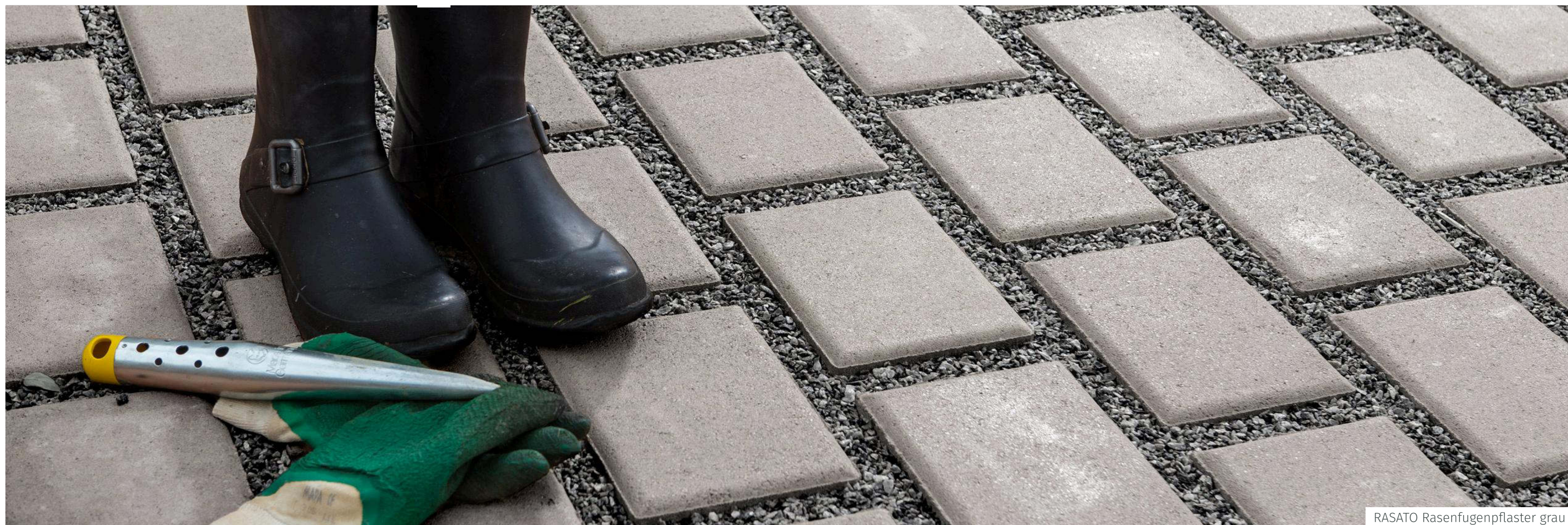
RASATO Rasenfugenpflaster grau

RASATO Pflaster hat als typisches Rasenfugenpflaster eine 30 mm breite begrünbare Pflasterfuge. Es eignet sich daher besonders für Zufahrten und Parkplätze.