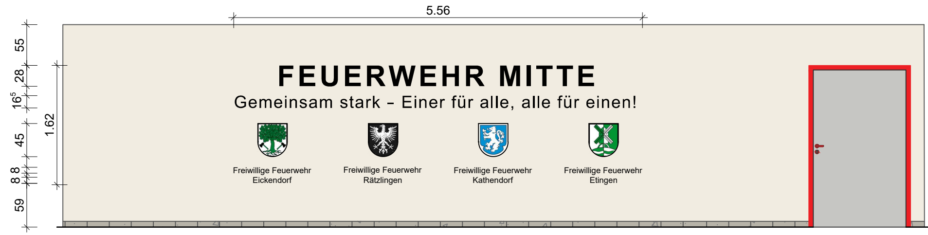
Wandgestaltung Flur EG - M 1:50