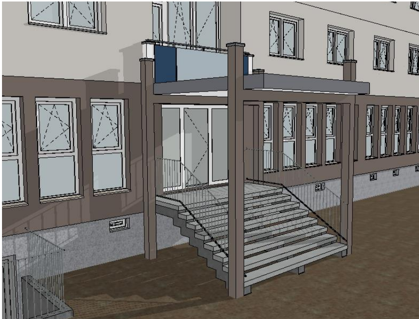
Hauseingang Nr. 4

Seitenwände im Eingangsbereich, Stützen und Träger: Farbe entsprechend der Fassadenfarbe RGB 136, 123, 115