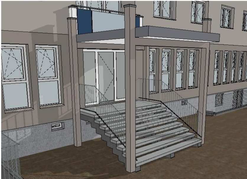
Hauseingang Nr. 6

Dach: Seiten - Aluminium matt Unterseiten - RGB 250, 250, 250; Weiß