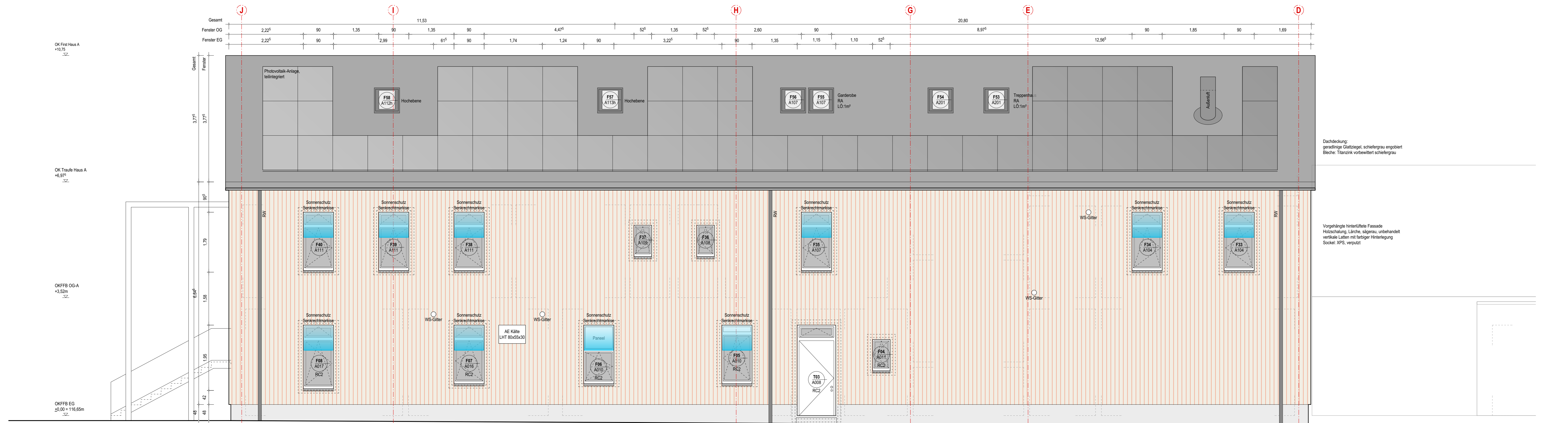
A-O: Haus A, Ansicht von Osten

Höhenbezug OK FFB 0.00 = 116.65 m (Bezugssystem DHHN2016)