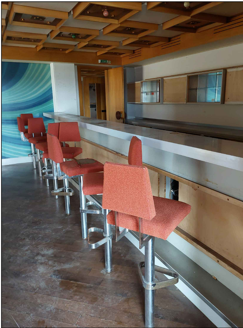
8 Barhocker (Polster und Edelstahl stark verschmutzt, 2 beschädigt) Barmöbel: Verkleidung aus Metall fehlt