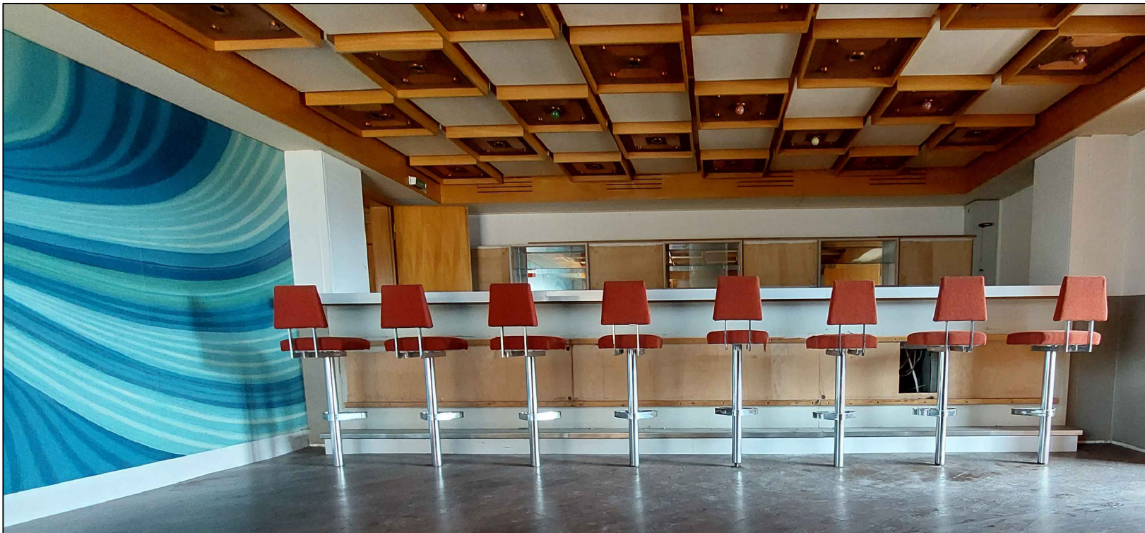
links: 4-teiliges Wandbild, Vordergrund: 8 Barhocker (Polster und Edelstahl stark verschmutzt, 2 beschädigt) Barmöbel: Verkleidung aus Metall fehlt