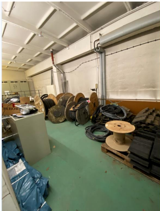
Vorgesehener Standort für die neue SV – NSHV