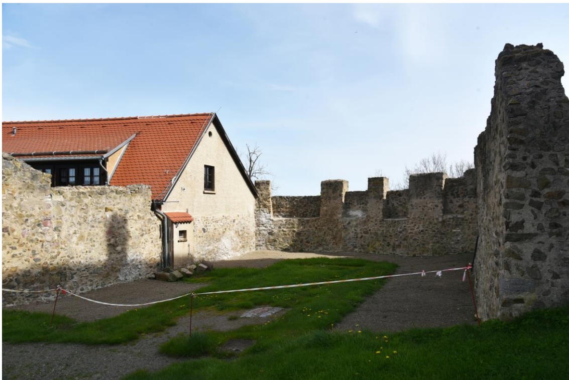
Abb. 9 Ansicht Standort Arbeitszelt