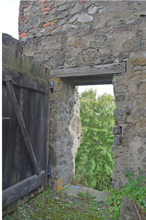
Abb. 11 Ansicht Außentür zur Baustelleneinrichtung