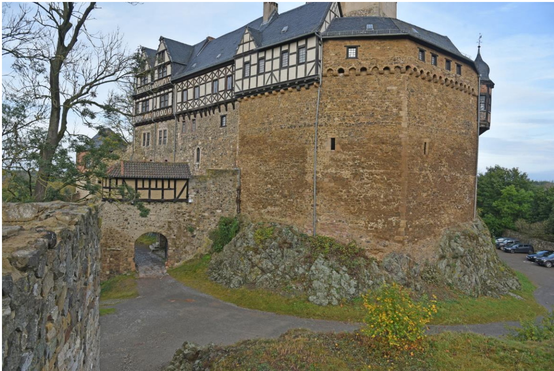
Abb. 3 Ansicht Tor II - möglicher Fahrweg für Transporter