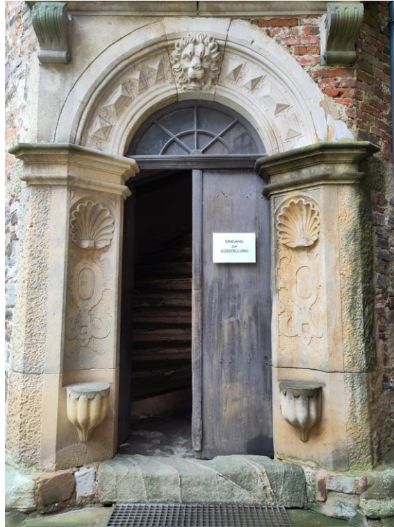
Abb. 15 Ansicht Zugang Wendelstein Südwestecke