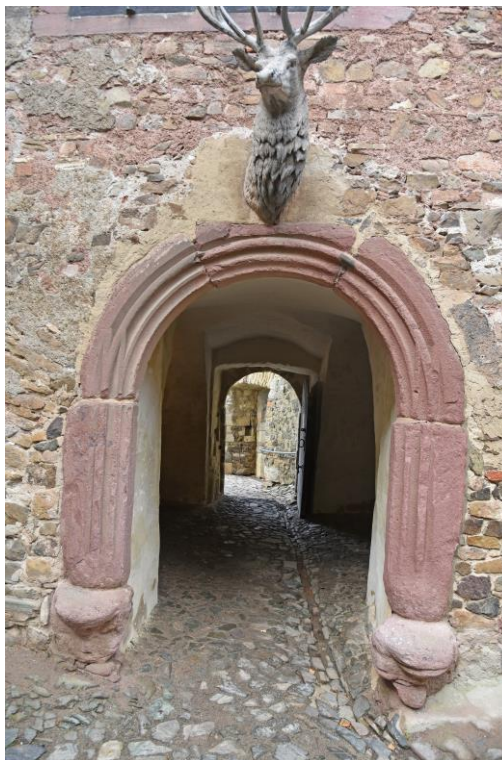
Abb. 14 Ansicht Tor VI - ausschließlich Laufweg