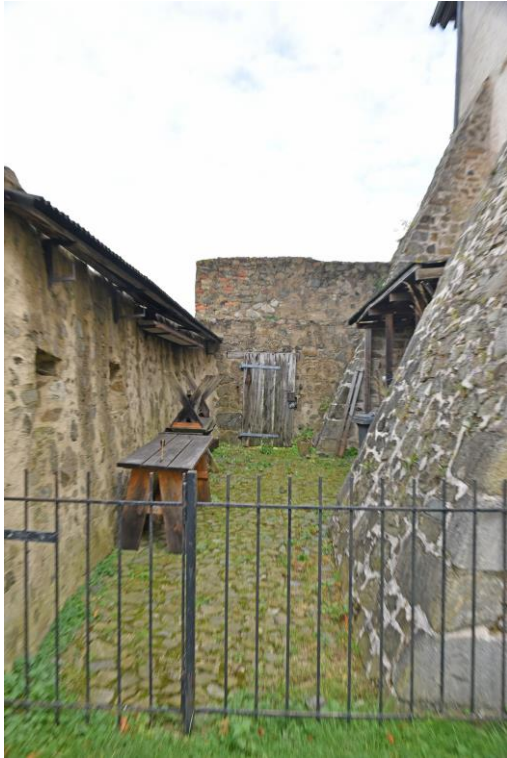
Abb. 10 Ansicht Außentür zur Baustelleneinrichtung