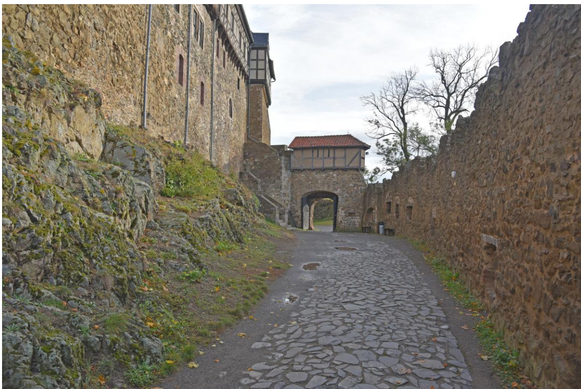
Abb. 4 Ansicht Weg hinter Tor II - möglicher Fahrweg für Transporter