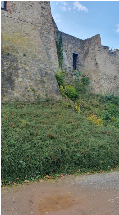
Abb. 13 Ansicht Außentür vom Parkplatz aus bzw. auf die zukünftige Baustelleneinrichtung mit Gerüsturm und Aufzug