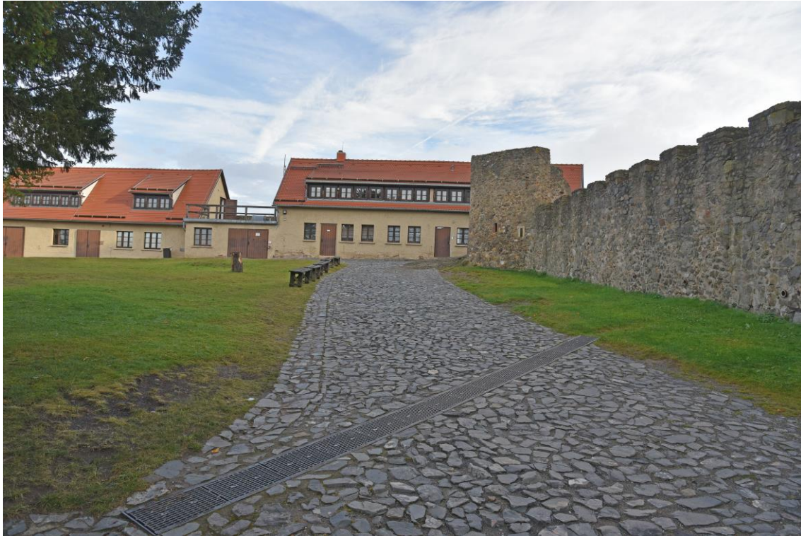
Abb. 6 Ansicht Weg zwischen Tor III und dem Tor IV (Durchgang) - möglicher Fahrweg für Transporter