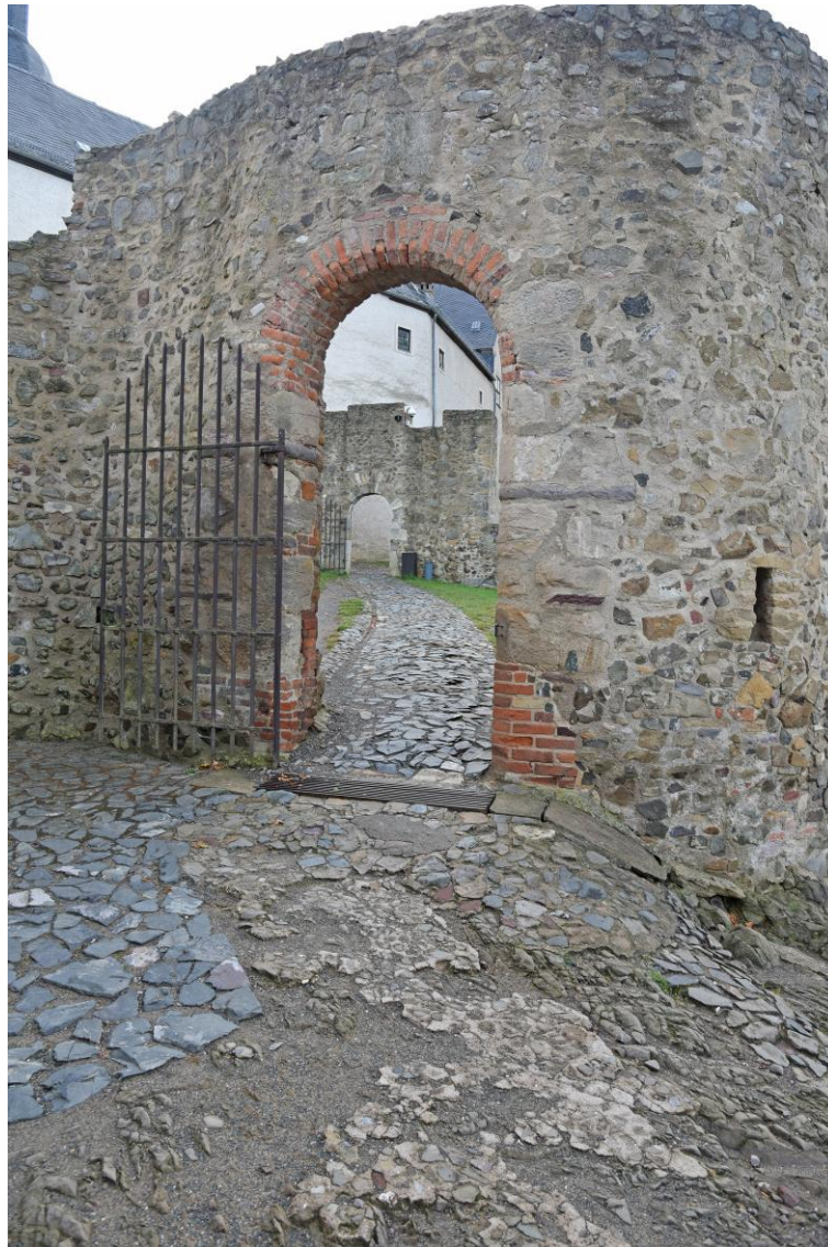
Abb. 7 Ansicht Tor IV und hinten Tor V - ausschließlich Laufweg