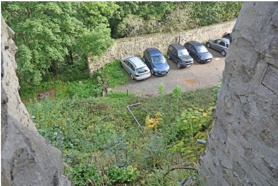
Abb. 12 Blick von der Außentür auf den Parkplatz bzw. auf die zukünftige Baustelleneinrichtung mit Gerüsturm und Aufzug