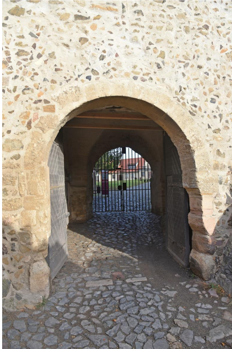
Abb. 5 Ansicht Tor III - möglicher Fahrweg für Transporter