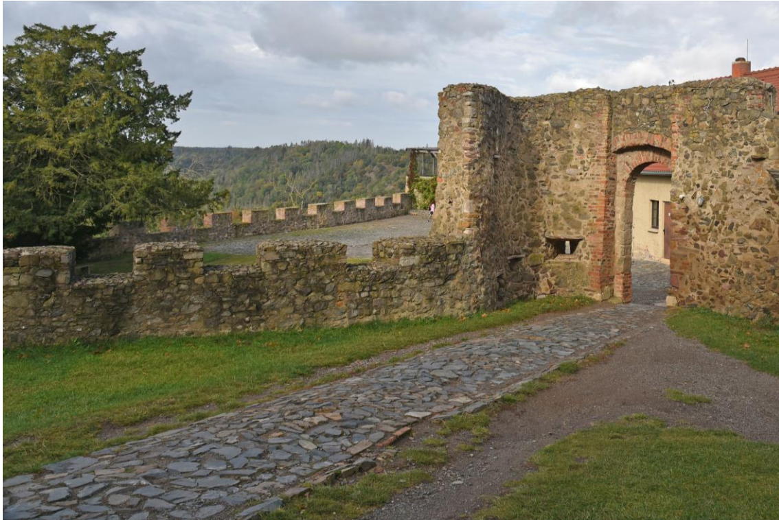
Abb. 8 Ansicht Weg hinter Tor IV - ausschließlich Laufweg