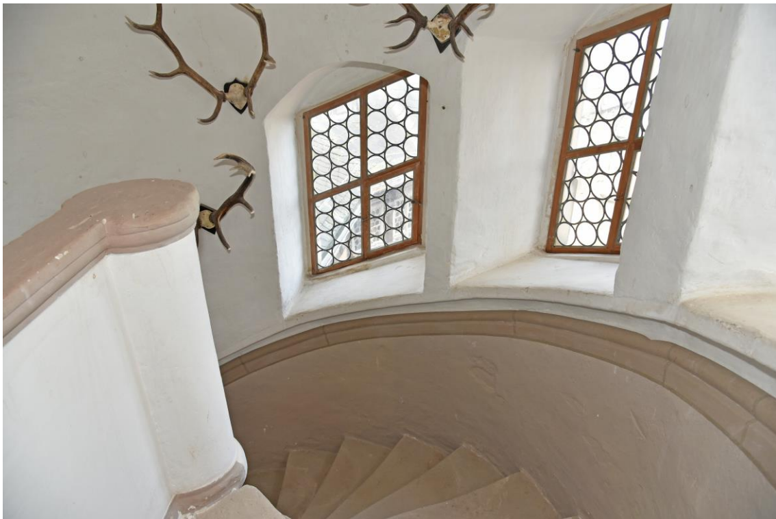
Abb. 16 Ansicht Treppenhaus Wendelstein Süd-West-Ecke