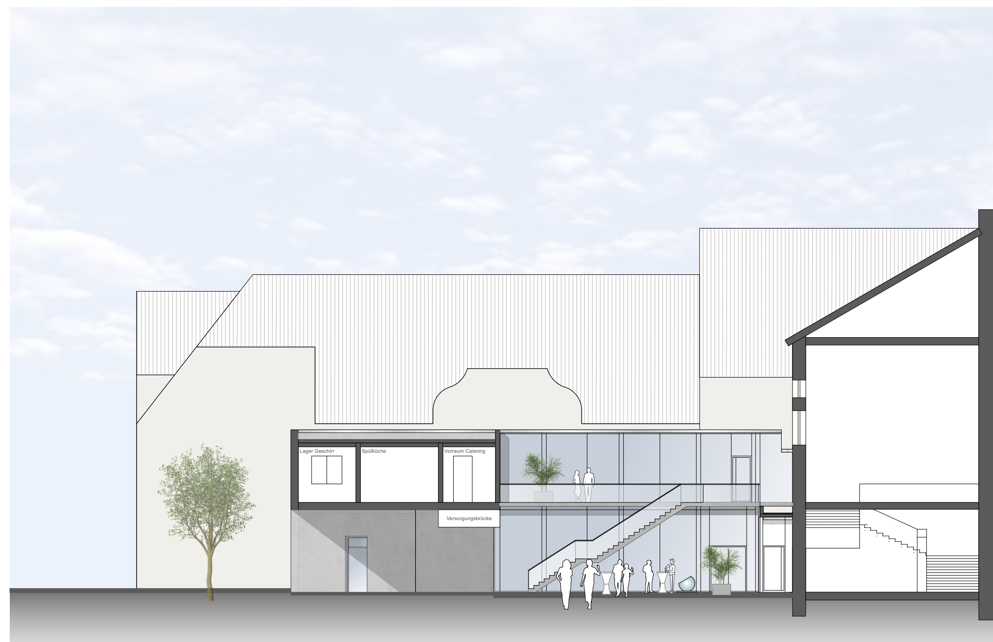
SÜD-WEST-ANSICHT ERWEITERUNGSBAU, INNENHOF