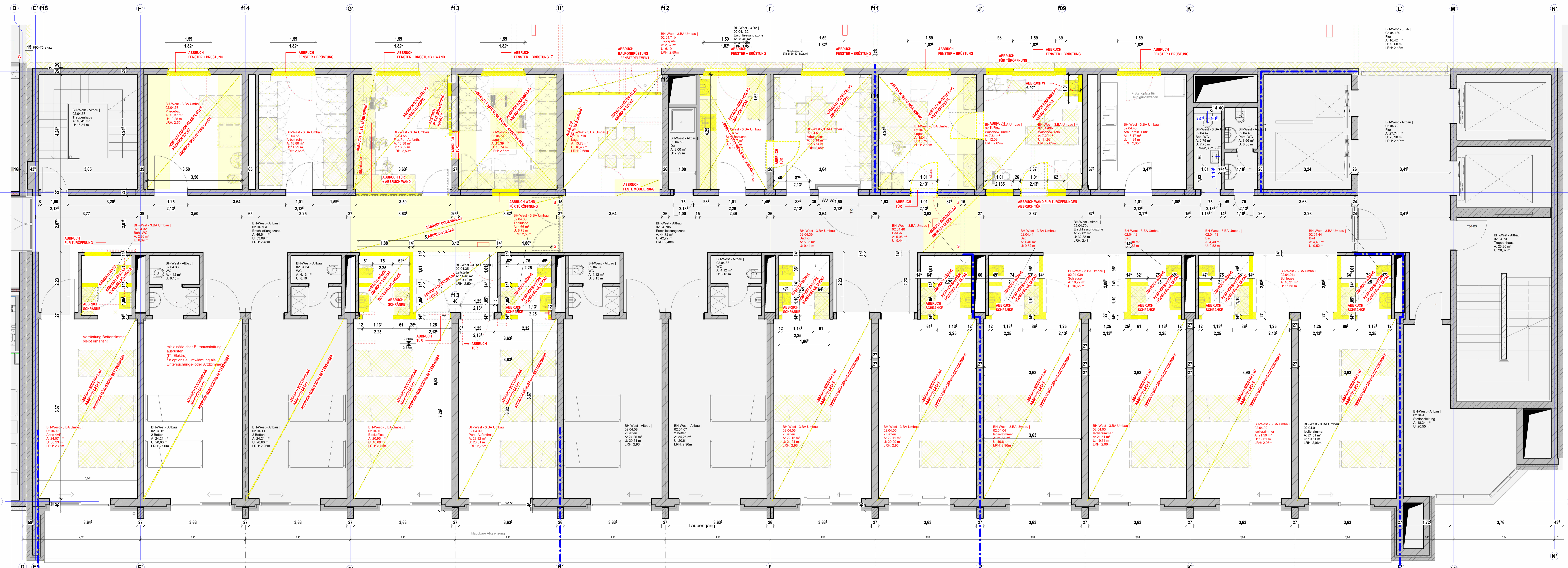
4. Obergeschoss - Rohbau - Abbruchplan M. 1:50