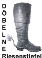
Konstanze Becker Vergabestelle – Stadt Döbeln