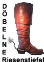
Konstanze Becker Vergabestelle – Stadt Döbeln