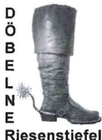
Konstanze Becker Vergabestelle – Stadt Döbeln