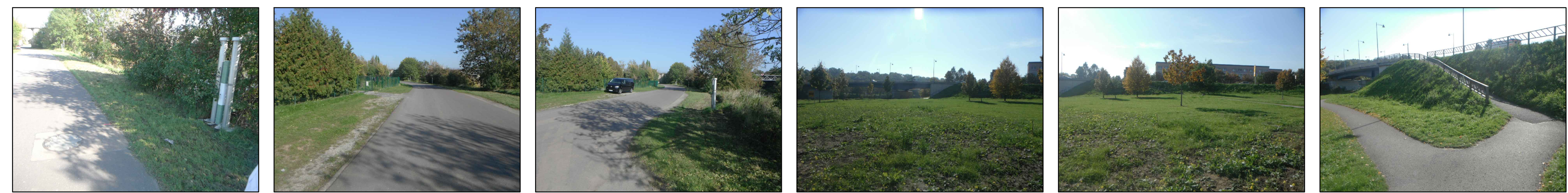
Station 0+000 Bauanfang: Schacht mit Belüftungsdom, Verlauf HWSA zwischen Dom und Schachtdeckung, Dom versetzen Station 0+050 Rückblick: Straße Am Werder, Anordnung HWS- Wand parallel zur rechten Straßenkante Station 0+070 Rückblick: Straße Am Werder, Anordnung HWS- Wand parallel zur Straße, rechts des Belüftungsdoms Station 0+150 Vorblick: Grünflächenbereich und im Hintergrund Annenbrücke Bereich der Geländemodellierung/-anhebung Station 0+150 Vorblick: Grünflächenbereich und Böschung Annenbrücke Bereich der Geländemodellierung/-anhebung Station 0+198 Anschlussbereich der Geländemodellierung an Böschung Annenbrücke