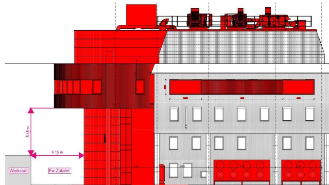
Abbildung 1: Ansicht Nord-West - Neubau, euroterra GmbH, Stand 15.09.2022

Das Gebäude wird gem. § 2 HBauO in die Gebäudeklasse 5 (Sonderbau) eingestuft.