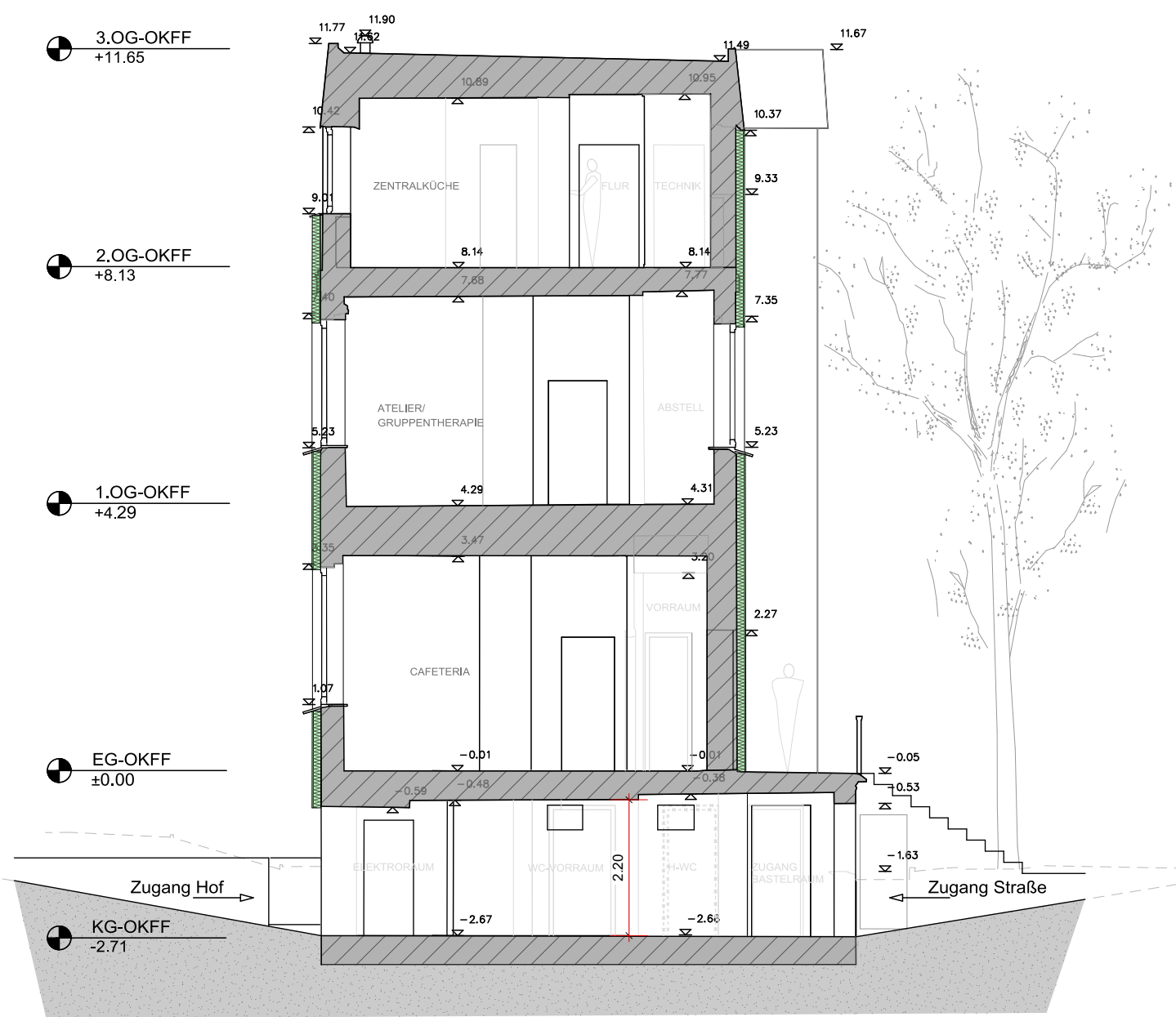
Schnitt A - A