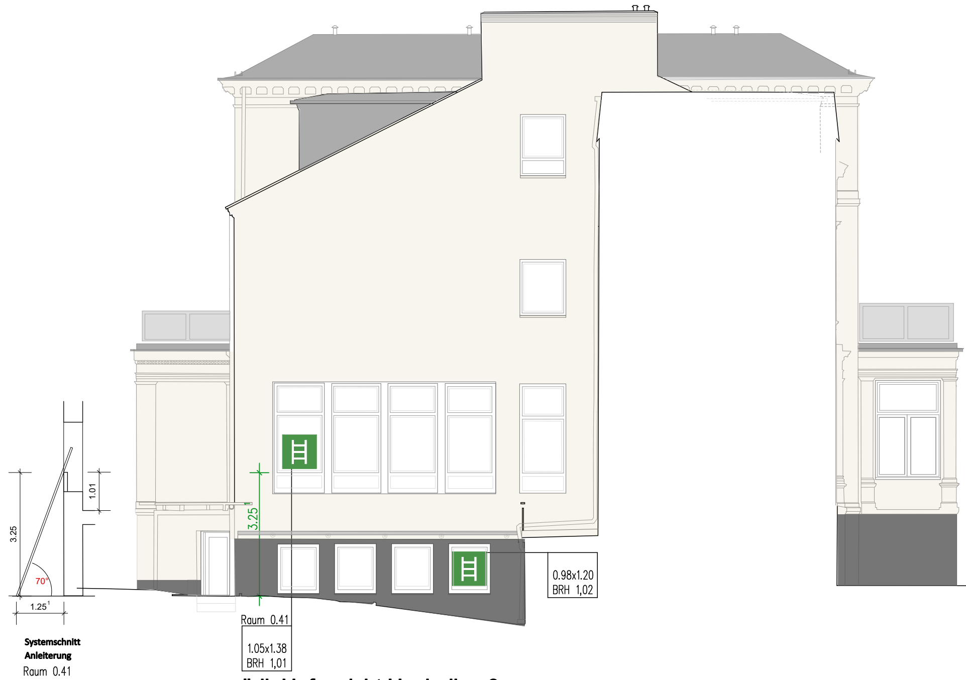
südl. Hofansicht Hochallee 3