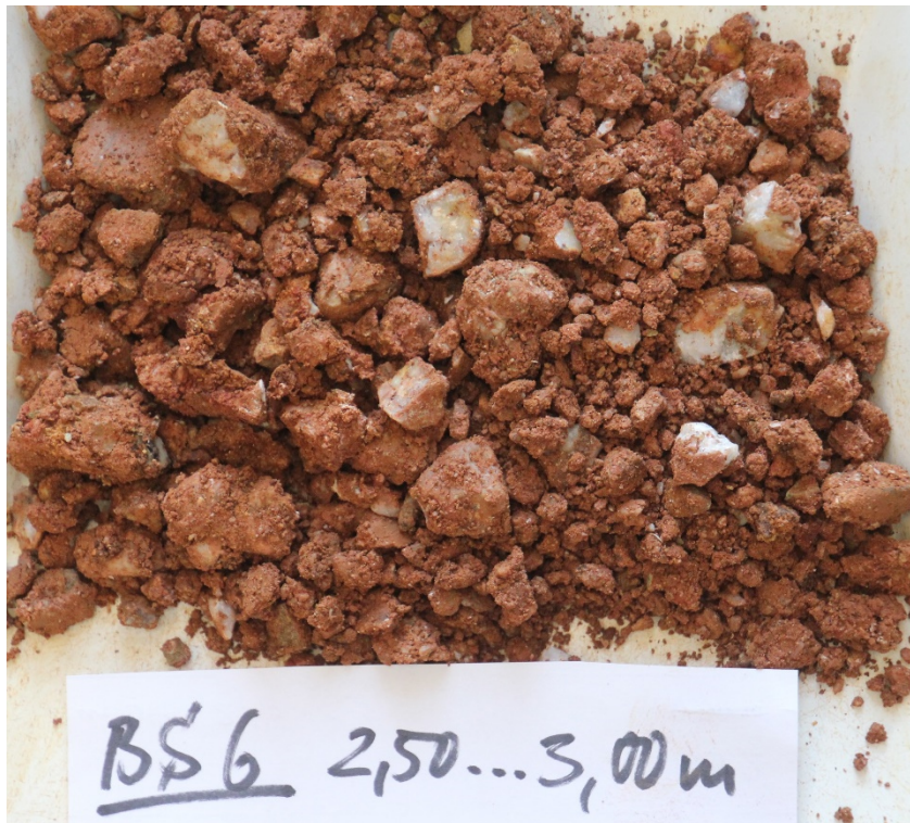
Foto 32: Bohrung BS 6 – Bohrkern 2,50...3,00 m/ Konglomeratzersatz