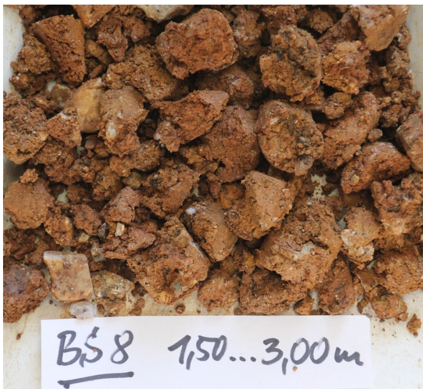
Foto 33: Bohrung BS 8 – Bohrkern 1,50...3,00 m/ Hang-/ Geschiebelehm