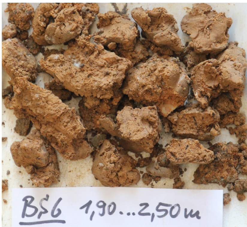
Foto 31: Bohrung BS 6 – Bohrkern 1,90...2,50/ Lößlehmartiger Gehängelehm