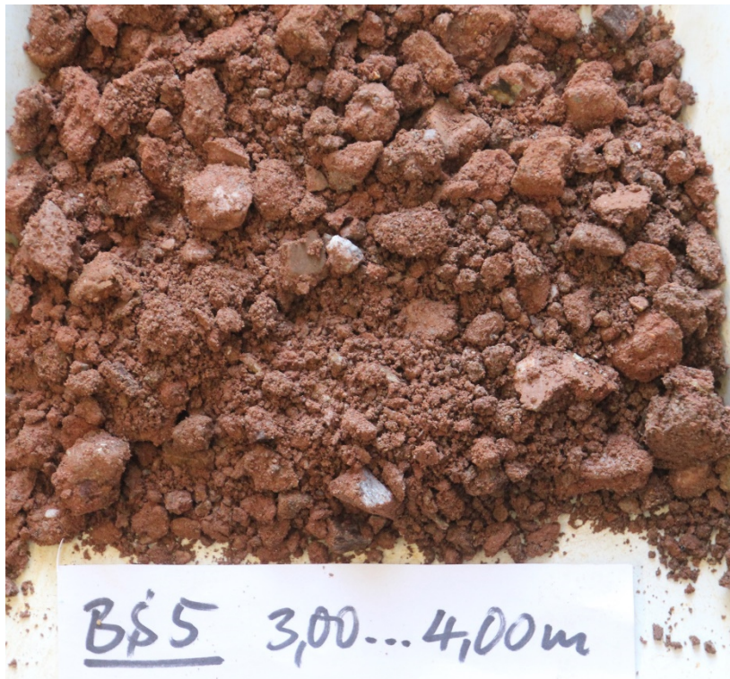
Foto 30: Bohrung BS 5 – Bohrkern 3,00...4,00 m/ Sandstein-/ Konglomeratzersatz