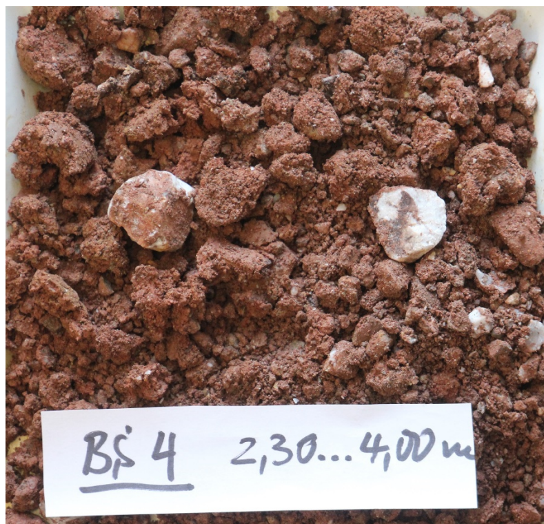
Foto 29: Bohrung BS 4 – Bohrkern 2,30...4,00 m/ Konglomeratersatz