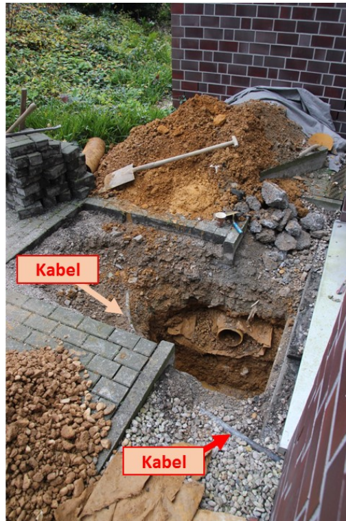
Foto 36: Schurf 1/21 – Kabel im Bereich des Schurfes/ Blick in Richtung Osten (17.01.2022)