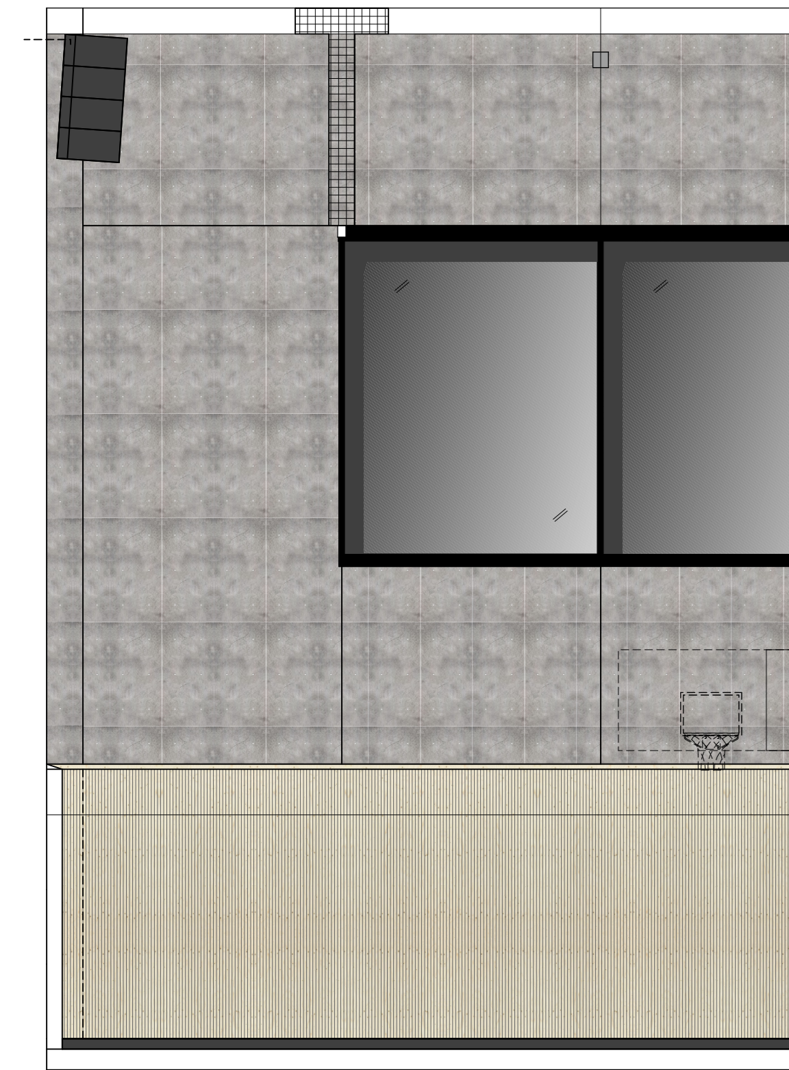
Materialkonzept Achse A