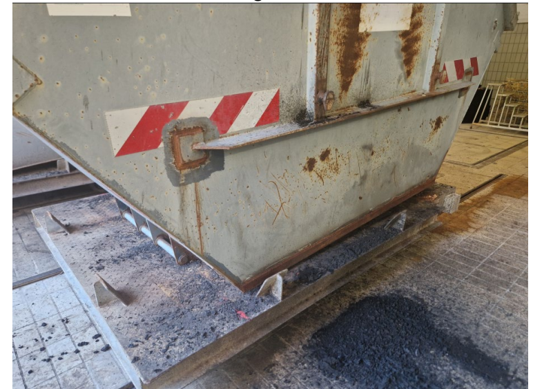
Abb. 1: Aufstellfläche Fahrwagen

Zur zulässigen Anzahl der transportierten Container bitte die Antwort auf Frage 1 beachten. Im Übrigen verweisen wir auf die Möglichkeit, die örtlichen Gegebenheiten auf der Gemeinschaftskläranlage Meißen zu besichtigen (s. Kapitel 5.1.2 der Leistungsbeschreibung).