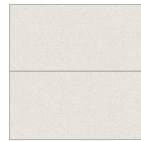
Fliesen Feinsteinzeug Format 30 / 60 Kreuzfuge