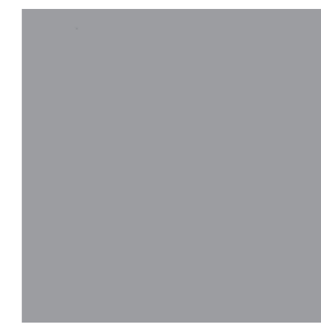
Bodenbeschichtung Epoxidharz R12V4