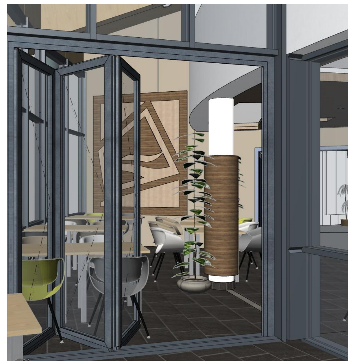
Farbe: RAL 7040 Fenstergrau