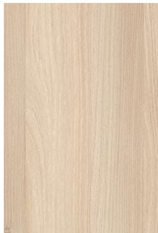
Dekor H1277 Lakeland Akazie Fa. Egger