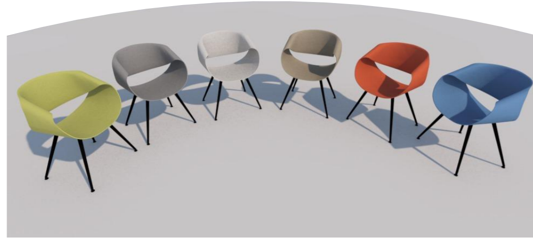
Little Perillo XS