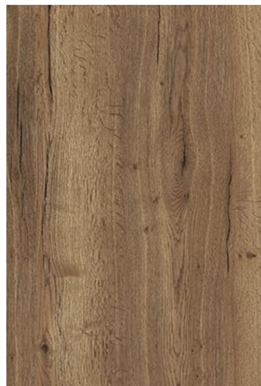
Dekor H1181 Halifax Eice tabak Fa. Egger