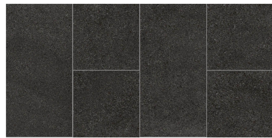
Fliesen Feinsteinzeug Format 30 / 60 versetzt, R10 + R11