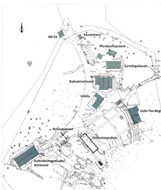
Lageplan Bestandsgebäude aus Vorentwurfsplanung Gebäude 05/2023

Zusätzlich ist eine Erweiterung der Ausstattung der Waldbühne (mobile Bühne und Groundsupport) geplant als eine wesentliche Grundlage für die nachhaltige Sicherung des Spielbetriebes und eine Verlängerung der Spielsaison. Die Ertüchtigungsmaßnahmen sollen eine temporäre Nutzung auch außerhalb der Sommermonate ermöglichen und die Angebotspalette erweitern.