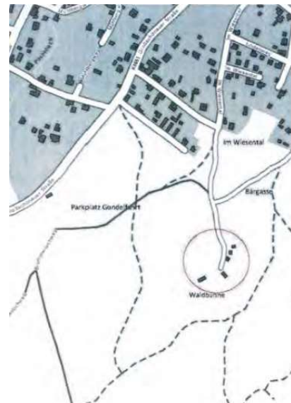
Übersicht Lageplan Waldbühne aus Vorentwurfsplanung Gebäude 05/2023