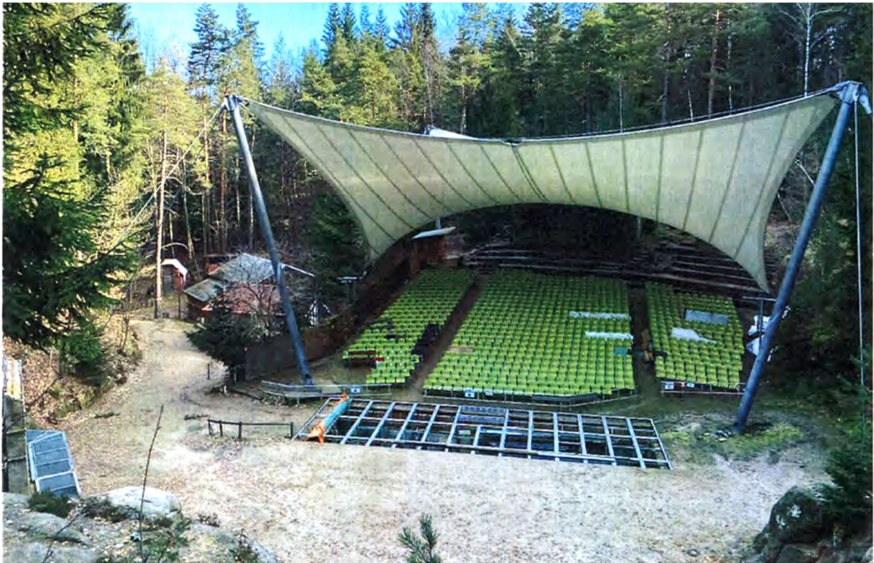
Waldbühne Jonsdorf, Foto aus Vorentwurfsplanung Gebäude 05/23