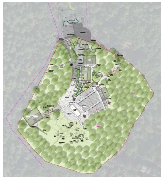
Übersicht Lageplan Maßnahmen Freianlagen, Vorentwurfsplanung Freianlagen 05/2023