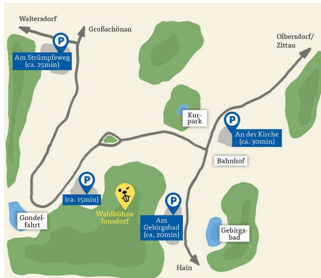
Übersicht Parkplätze in der näheren Umgebung