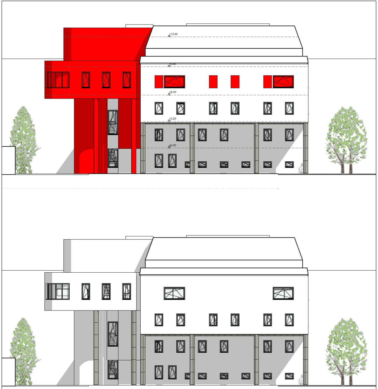
Oben: Ansicht West euroterra Architekten und Ingenieure (Rot = Neubau) - Stand 17.01.2022

Auf dem Gelände des Israelitischen Krankenhauses in Hamburg soll der bestehende OP-Trakt im Bereich des 3. Obergeschosses erweitert und technisch saniert werden.