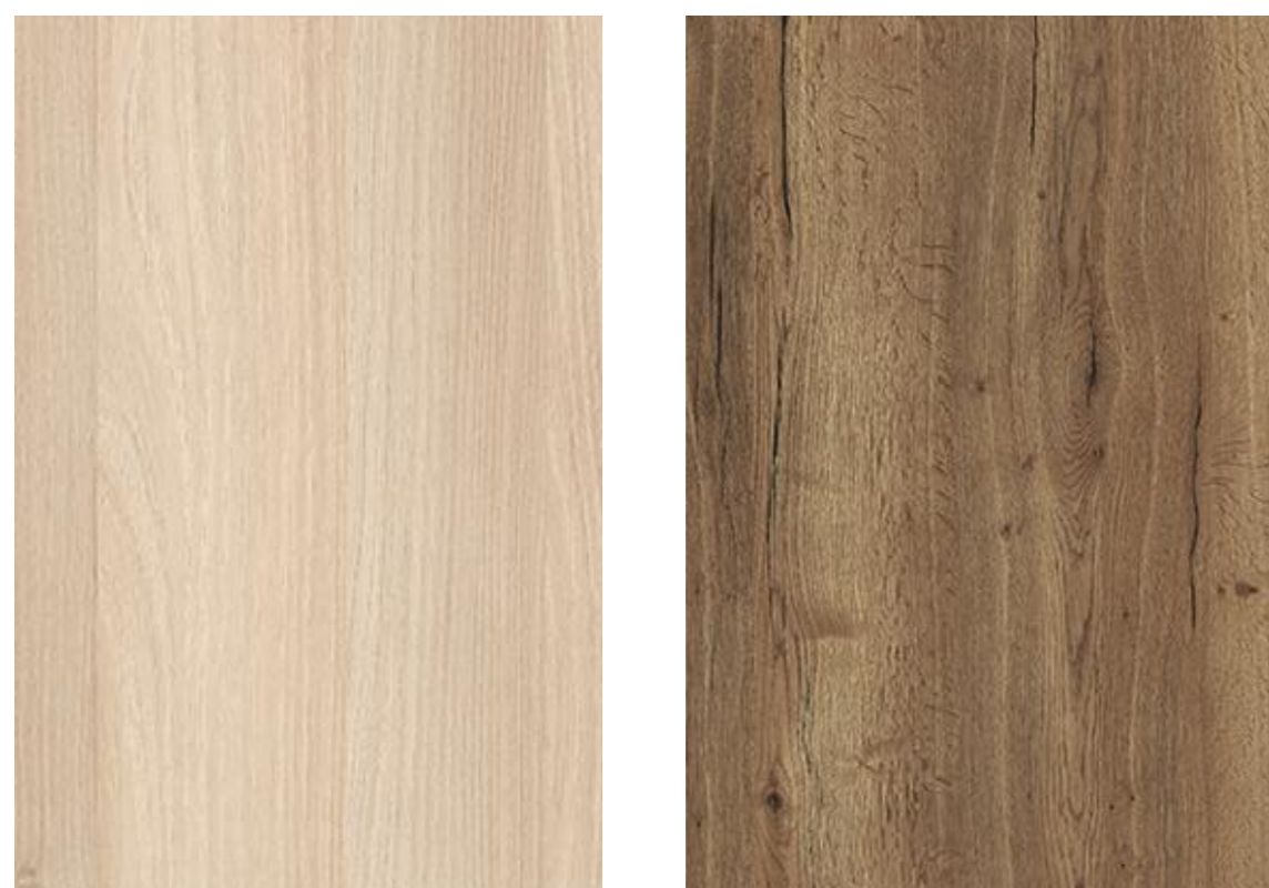
Dekor H1277 Lakeland Akazie Fa. Egger