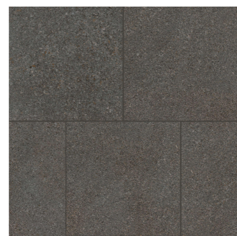
Fliesen Feinsteinzeug Format 30 / 30 versetzt, R11