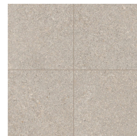
Fliesen Feinsteinzeug Format 20 / 20 R12C