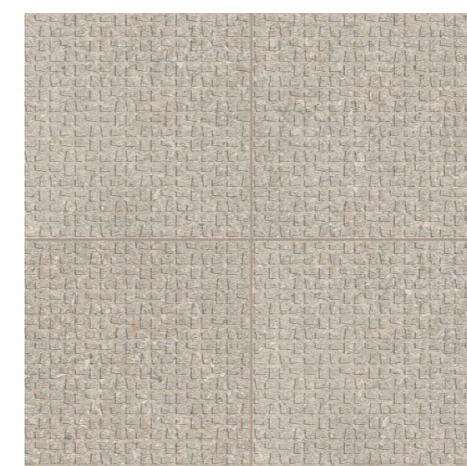
Fliesen Feinsteinzeug Format 20 / 20 R12V4