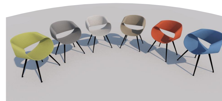
Little Perillo PT042