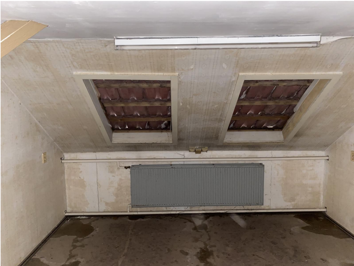
aufgegebene Büroausbauten im Dachboden des Hauptgebäudes