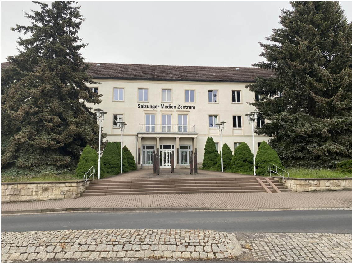
oben: Straßenansicht (Westen) Hauptgebäude