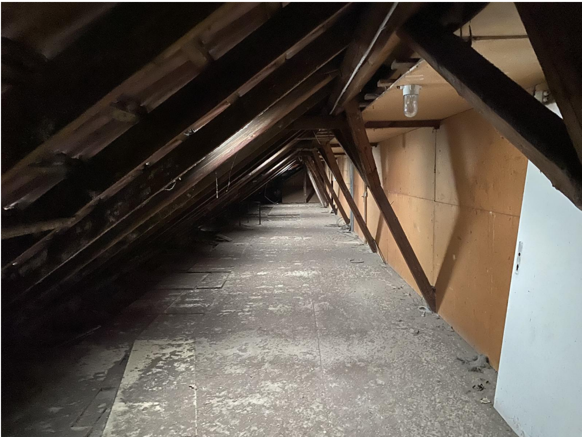
abgetrennte Raumbereiche im Dachboden des Hauptgebäudes