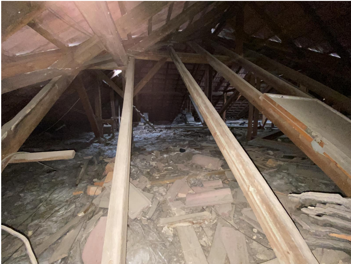
bauliche Situation im Dachraum des Südflügels