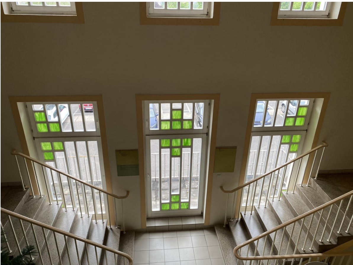
Fenster der Eingangshalle in der Ostfassade des Hauptgebäudes