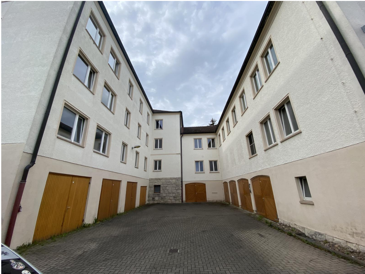
Innenhof zwischen den beiden Nordflügeln