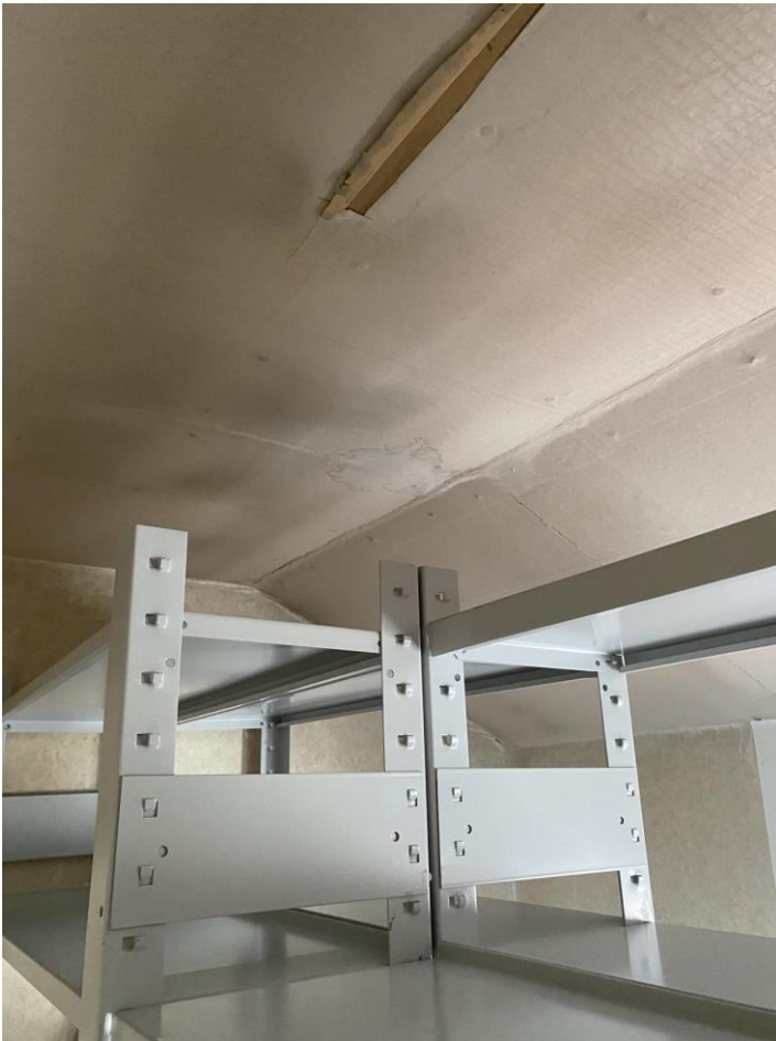
Ausbauzustand der Dachbekleidung im Anbau