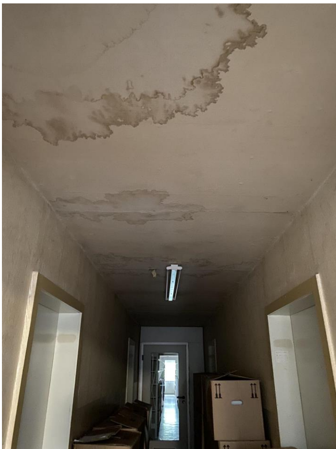
Wasserschäden im Dachboden des Anbaus