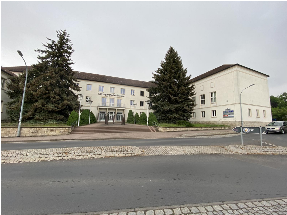
unten: Straßenansicht mit Südflügel