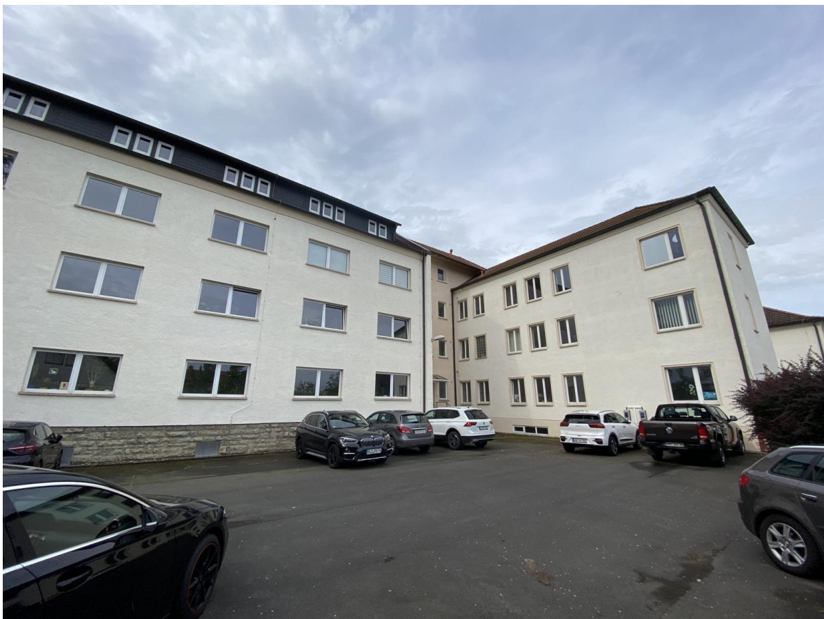
links im Bild der nord-östliche Anbau, rechts im Bild der mittlere Nordflügel