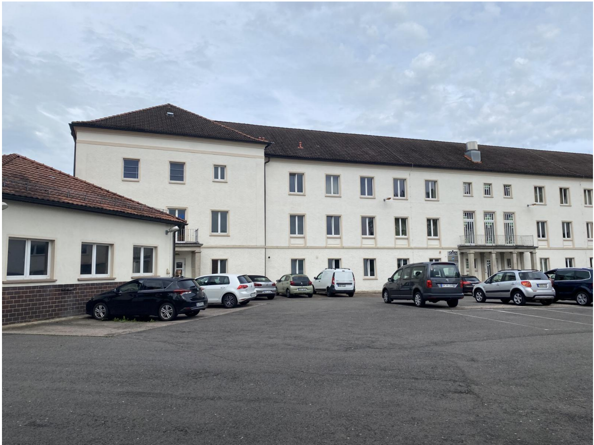
Rückansicht von Osten mit dem Südflügel, links das Garagengebäude