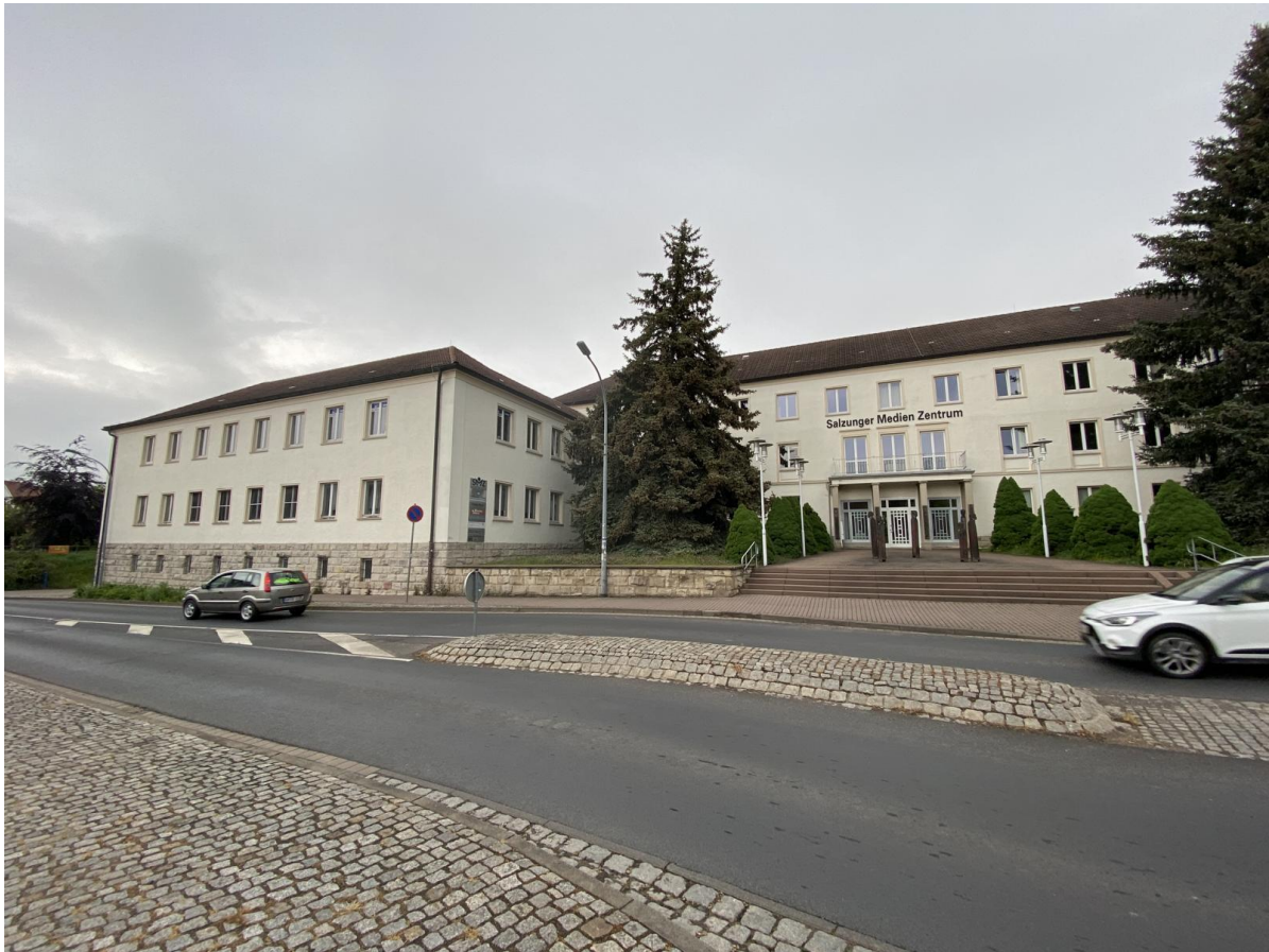
Hauptgebäude mit Nordflügel