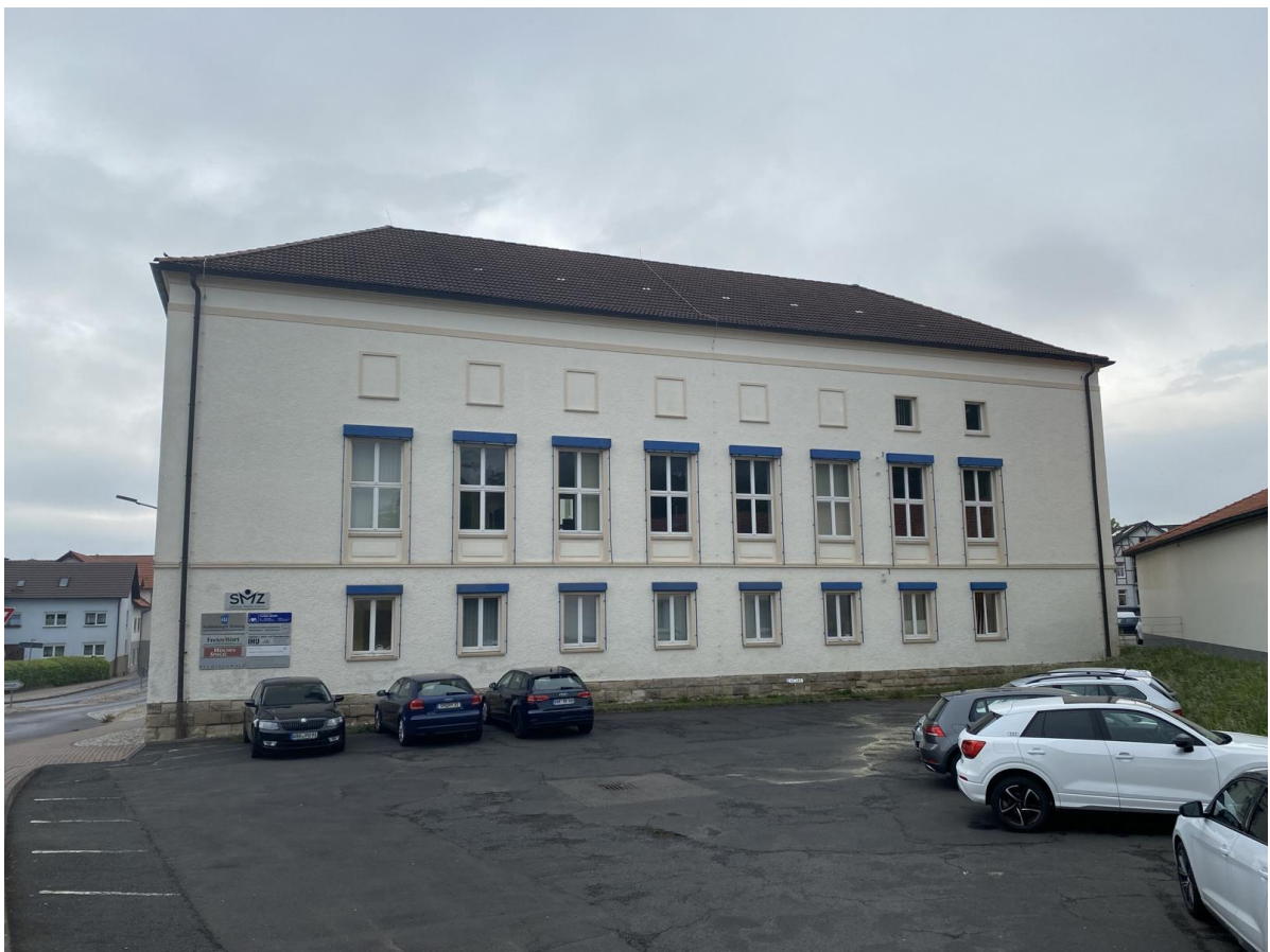
Südfassade des Südflügels, mit außenliegendem Sonnenschutz