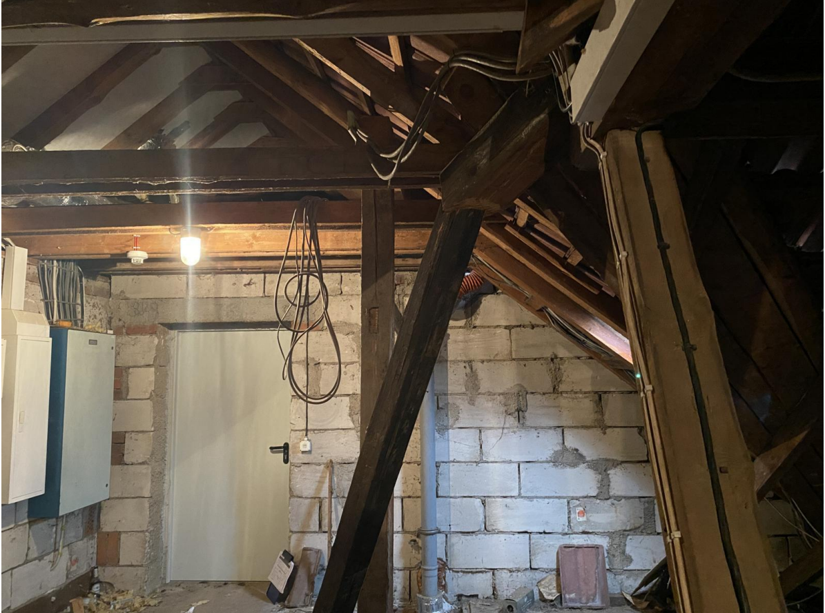
Ausbauzustand des Dachbodens