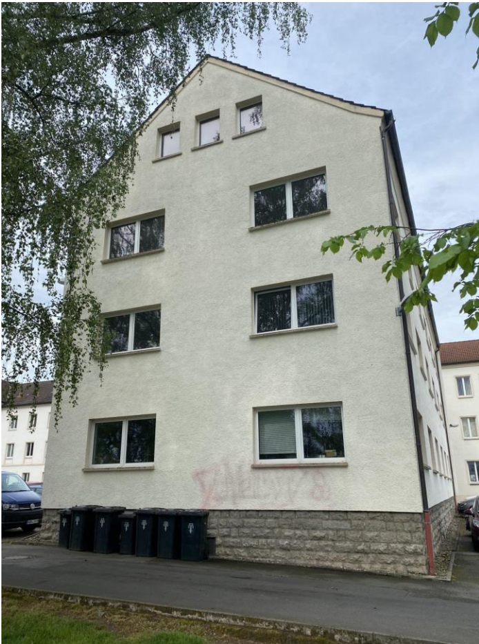
Ostgiebel des Anbaus