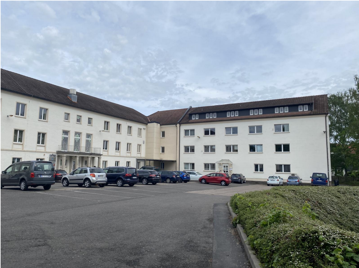
Hofansicht Ostseite, rechts im Bild der Anbau, in der Innenecke ein angebauter Aufzug