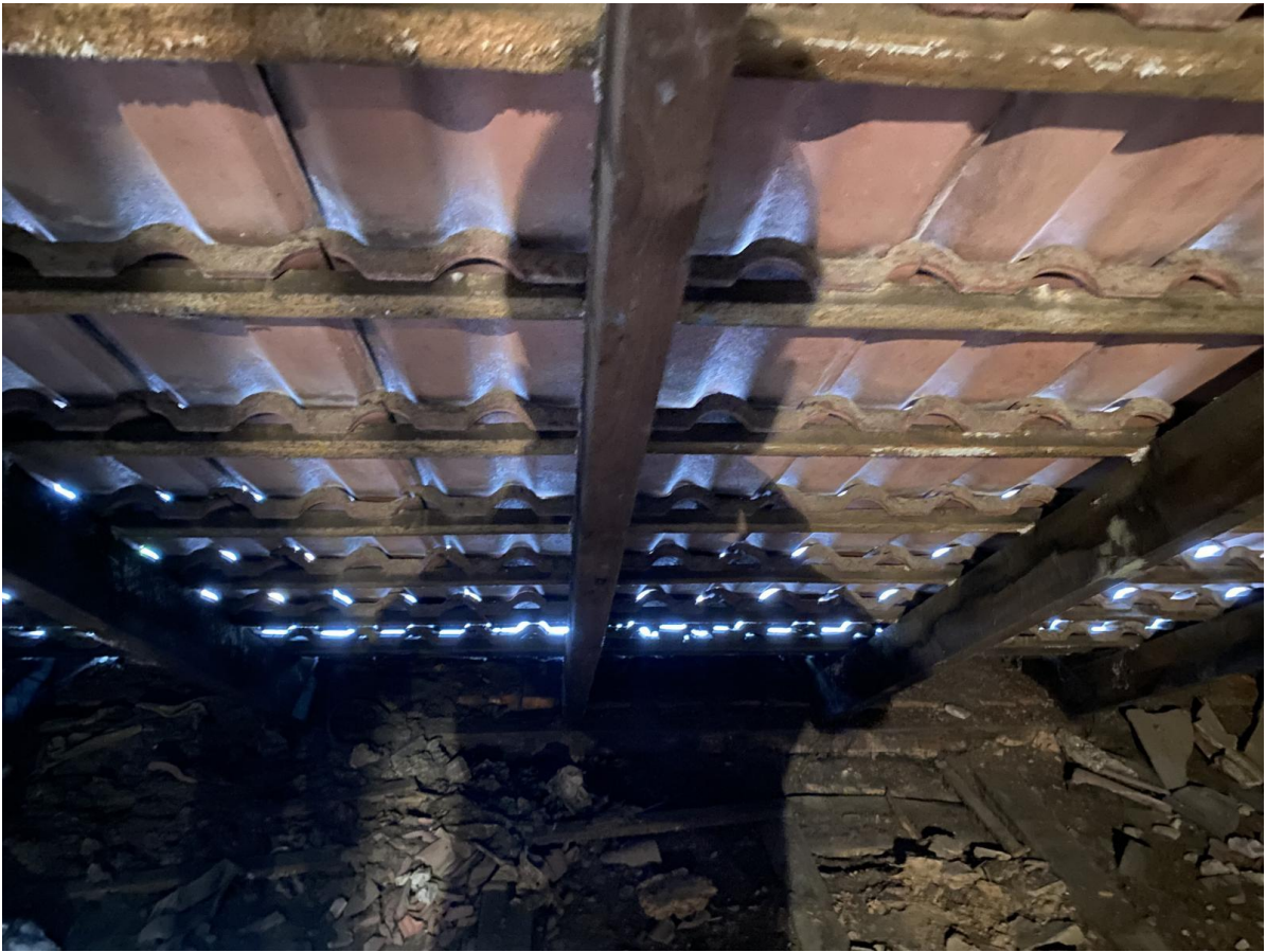
Innenansicht Dachdeckung auf dem Hauptgebäude